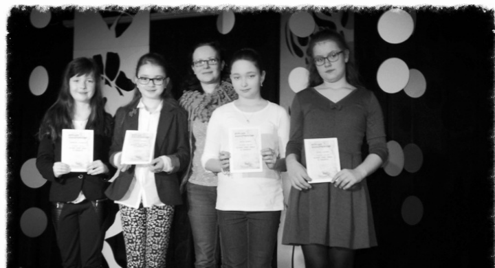
"Cztery pory roku w wierszu"