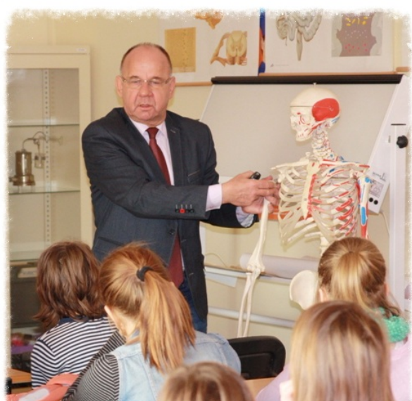
Lekcja przyrody AB