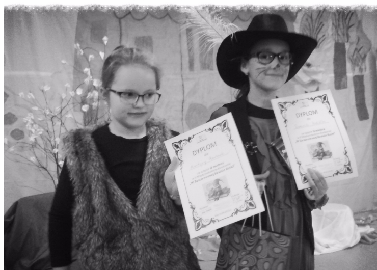
"W zaczarowanej krainie baśni"