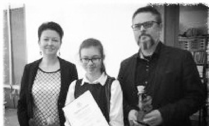
„Legenda wieszczka Adama”