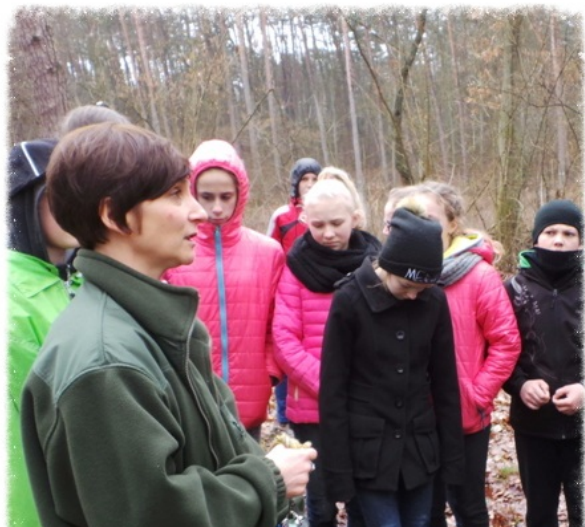
"Kalinka" - Nadleśnictwo Kaczory KD