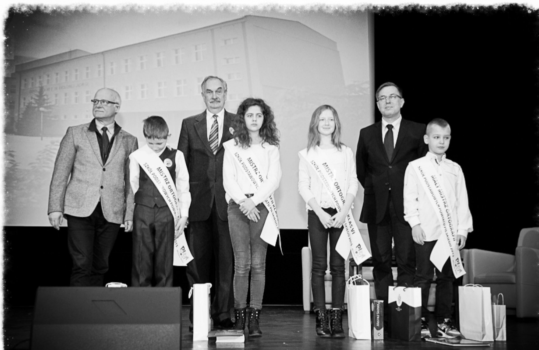
Gala III edycji "Dyktanda 500"