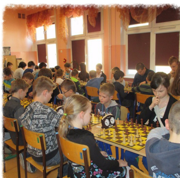
II Turniej Szachowy JP