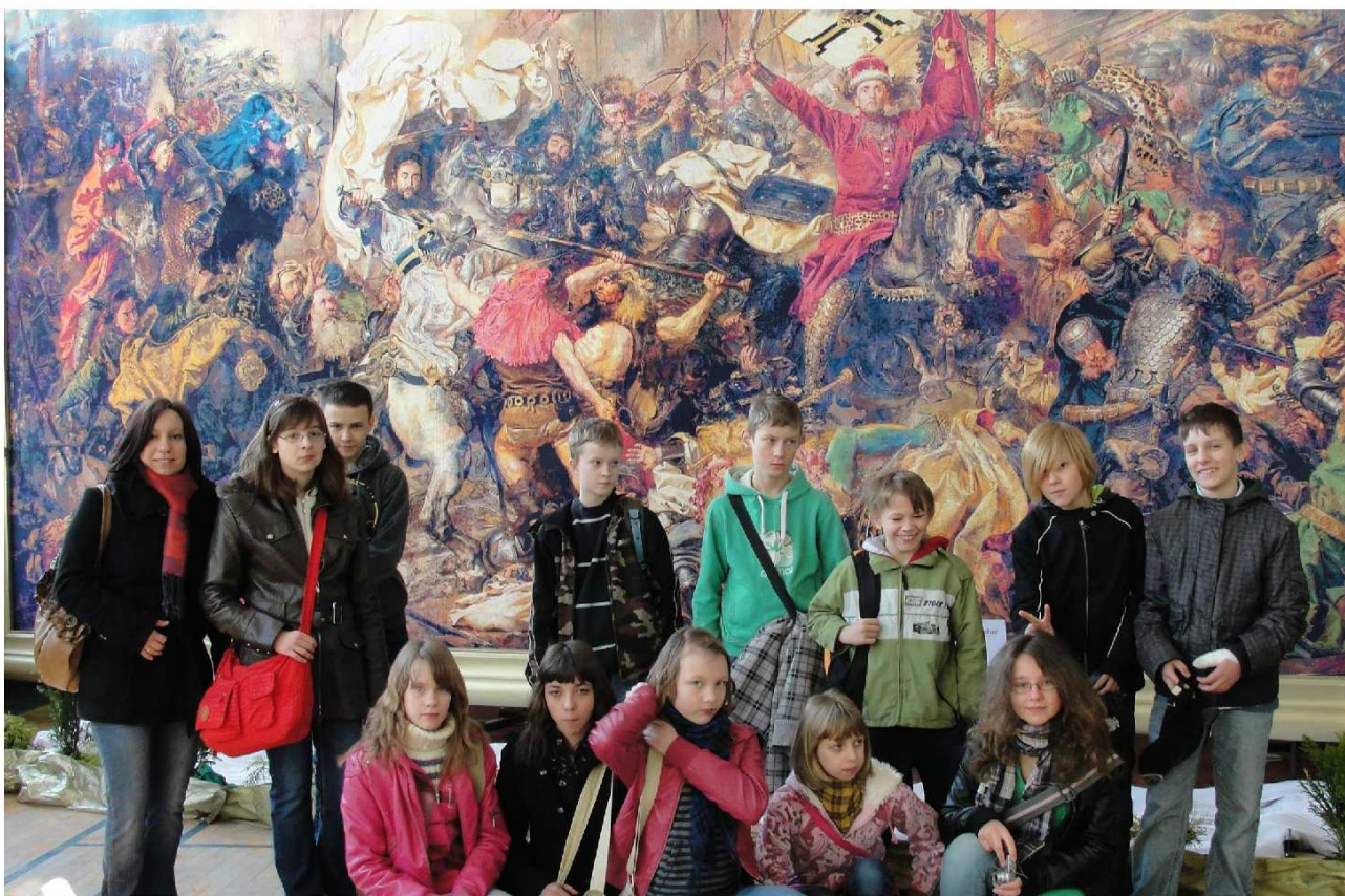
FOT: uczniowie klas 5 i 6 pod repliką obrazu Jana Matejki "Bitwa Pod Grunwaldem" w szkole w Ostrowie Lubelskim.