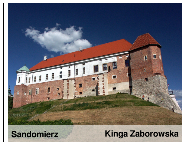
Sandomierz Kinga Zaborowska

Sandomierz posiada znaczną liczbę zabytków, a Stare Miasto tworzy zabytkowy zespół urbanistyczno-architektoniczny i krajobrazowy. Warto zobaczyć zamek królewski oraz przejść piwnicami w podziemnej trasy turystycznej.