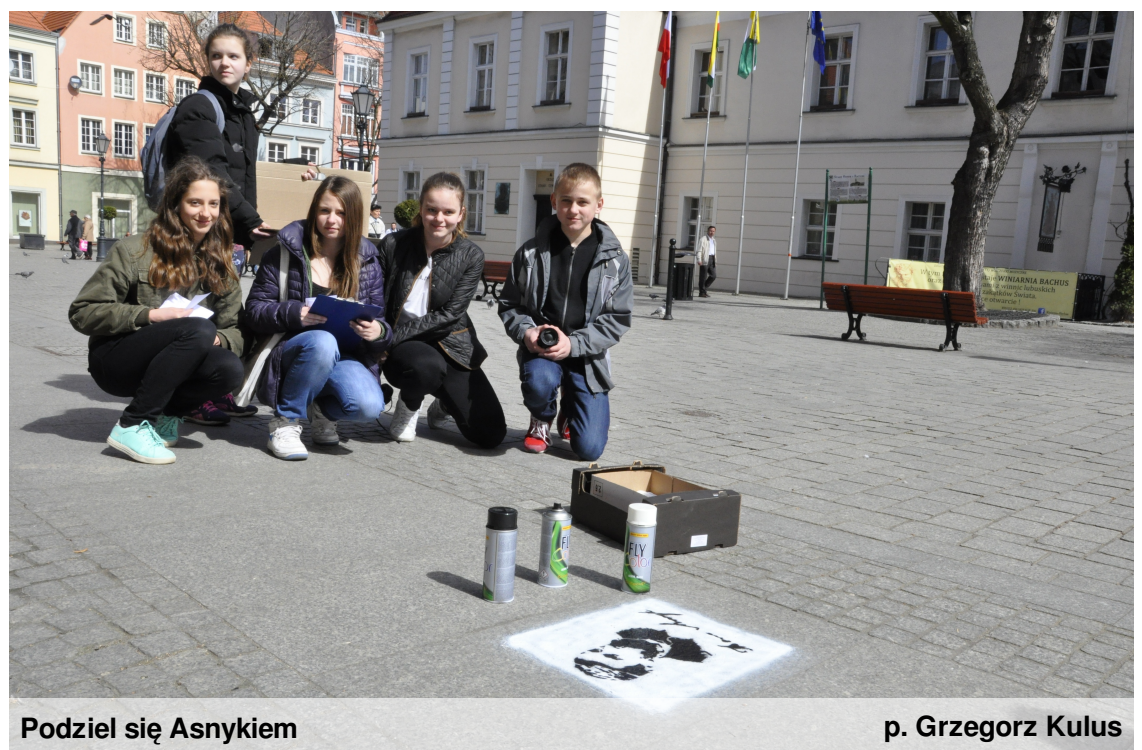
Podziel się Asnykiem