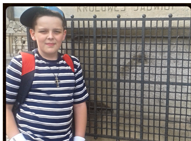
Stopka Królowej Jadwigi