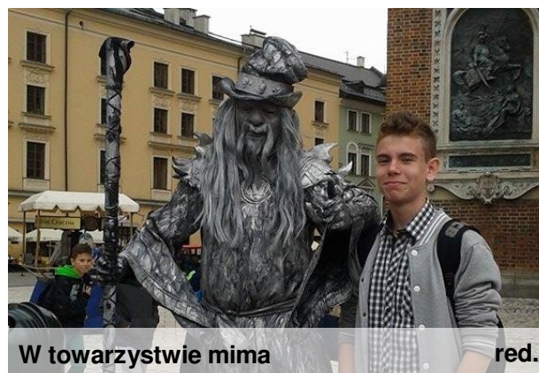
W towarzystwie mima

Kraków o każdej porze roku jest miejscem pełnym uroku. Dlatego też nie odmówiliśmy sobie przyjemności odwiedzenia wawelskiego smoka, czy obejrzenia Kościoła Mariackiego.