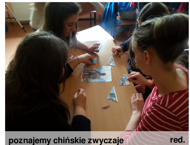
poznajemy chińskie zwyczaje