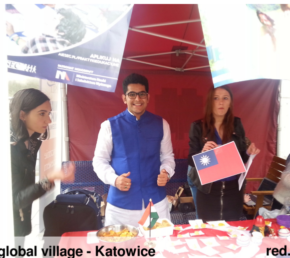
global village - Katowice