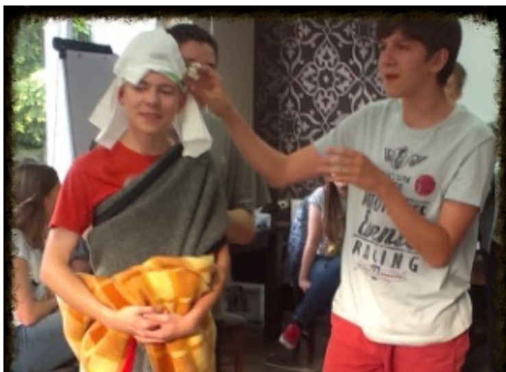
kreatywność to podstawa :)

Nareszcie! Po kilkutygodniowych oczekiwaniach grupa z naszej szkoły wybrała się na Euroweek! W „europejskim tygodniu” udział wzięła grupa 20 osób, w tym trzech nauczycieli. Miejsce – malownicze Długopole Dolne, położone na Ziemi Kłodzkiej. Europejskie Forum Młodzieży – organizator obozu – propaguje integrację europejską, działalność społeczną oraz lokalną demokrację. To jedna z najaktywniejszych młodzieżowych organizacji w naszym kraju i regionie. Organizuje szkolenia, konferencje, seminaria oraz festyny.