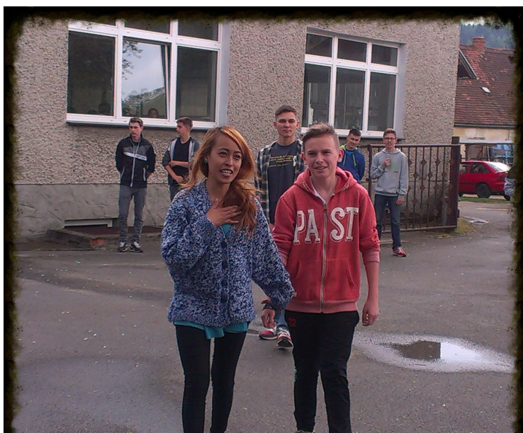
zajęcia z wolontariuszami