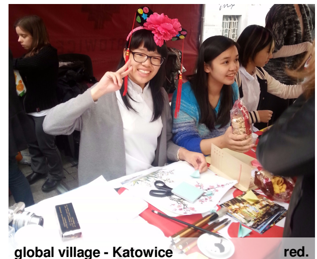
global village - Katowice