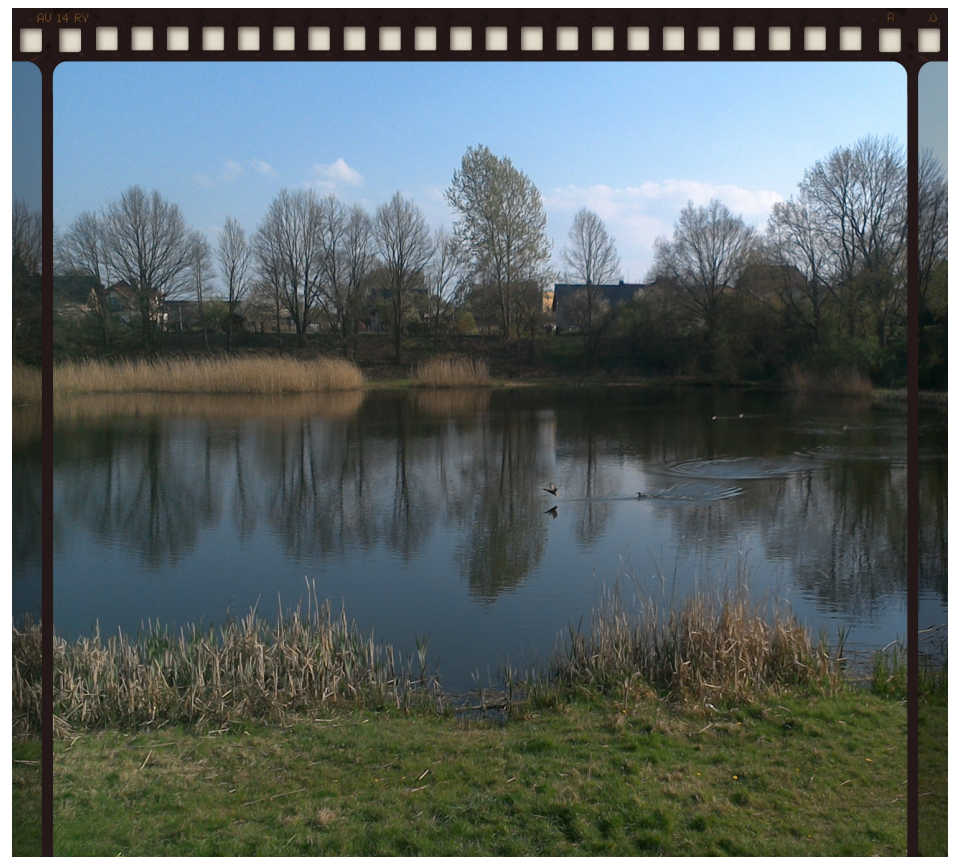
JEZIORO ŁŚNIĄCYCH WÓD