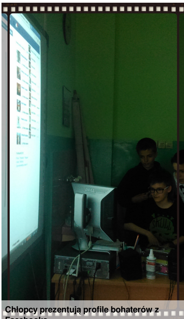
Chłopcy prezentują profile bohaterów z Facebooka