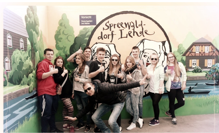
Spacer po mieście.