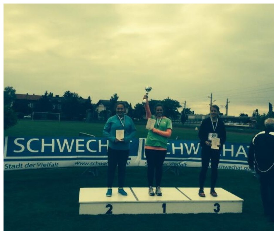
Zwycięstwo w Wiedniu

Dumny jest z niej nie tylko trener, ale także Dyrekcja, grono pedagogiczne i cała społeczność szkolna. Wszyscy będziemy jej kibicować i trzymać za nią kciuki.