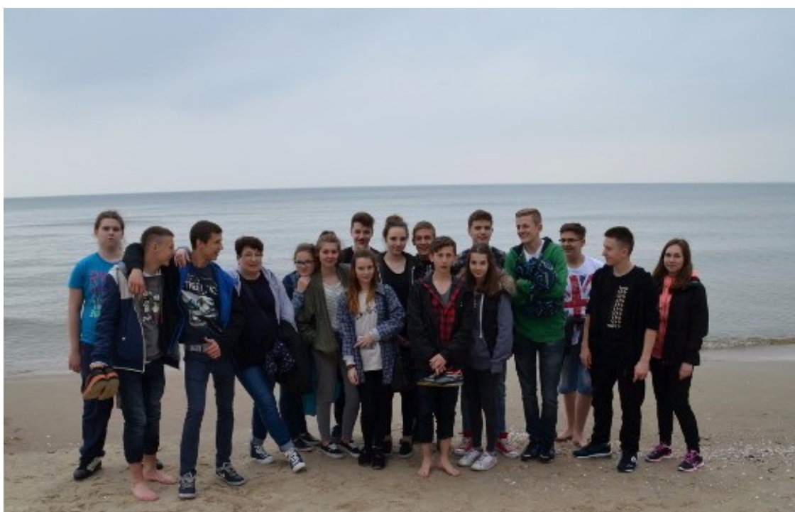
Klasy trzecie na plaży