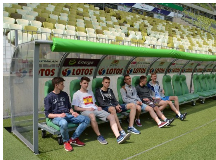
Stadion PGE Arena