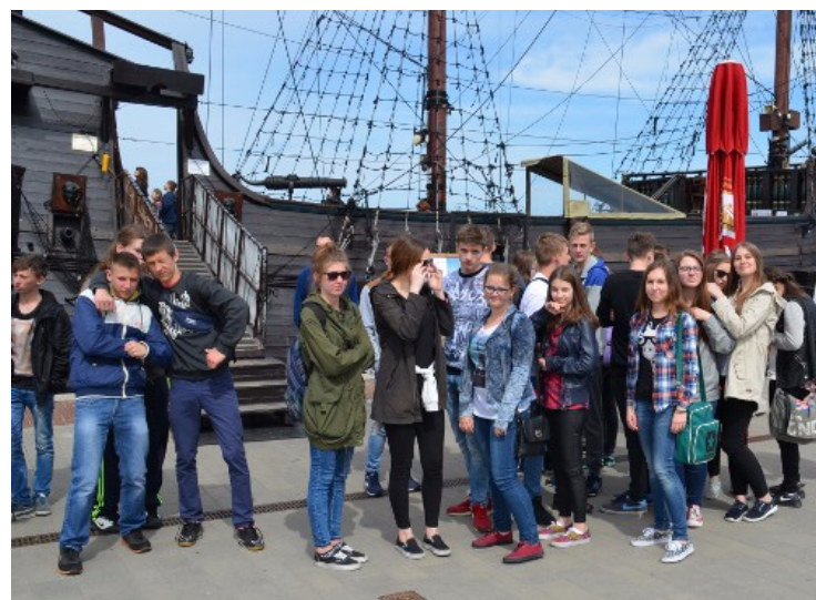
Na tle statku