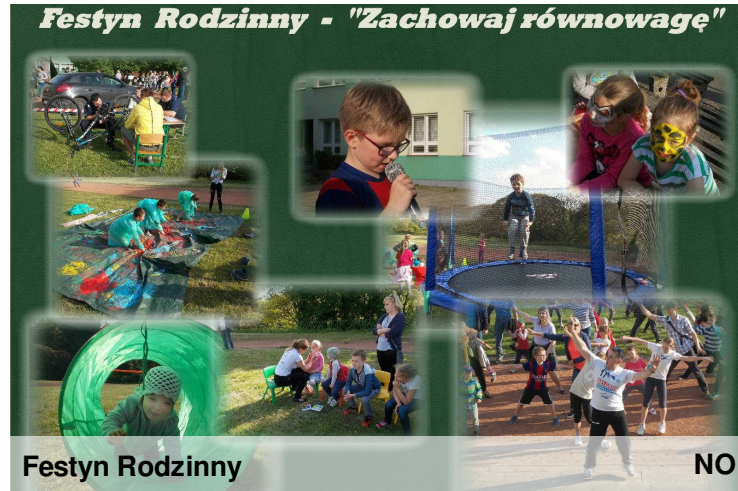
Festyn Rodzinny NO