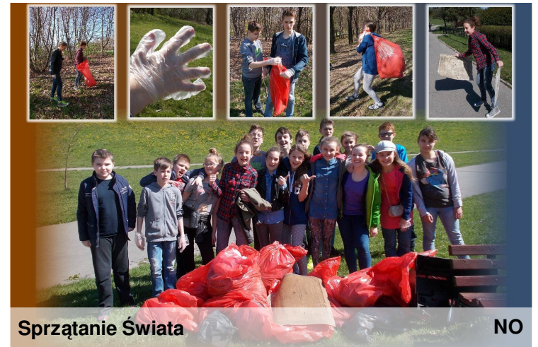
Sprzątanie Świata NO