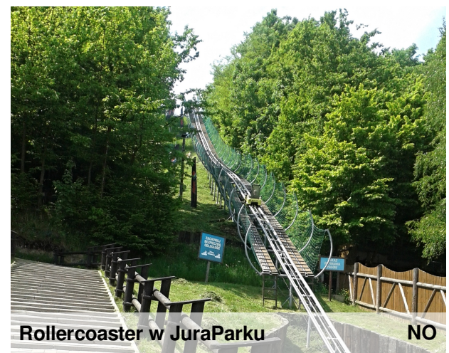
Rollercoaster w JuraParku