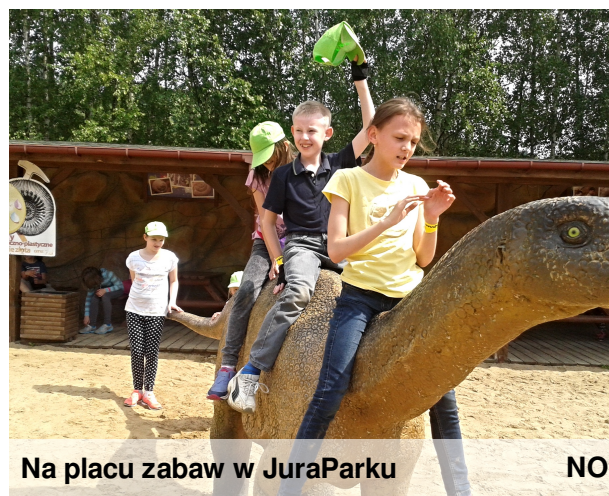
Na placu zabaw w JuraParku