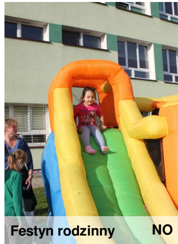
Festyn rodzinny NO

Zabawa była wspaniałą! Dziękujemy i czekamy na następny taki festyn.