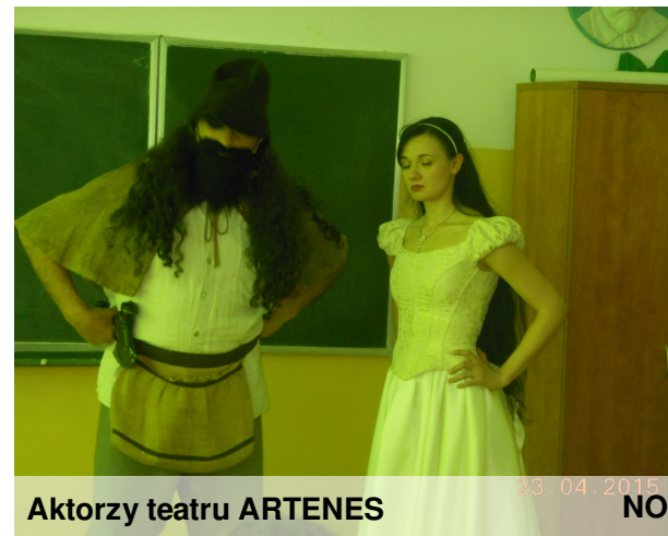
Aktorzy teatru ARTENES

23 kwietnia odbyły się warsztaty teatralne. Aktorzy z wrocławskiego teatru Artenes przyszli do nas i pokazywali nam wiele ciekawych sztuczek dotyczących ruchu scenicznego, oddechu i sposobu operowania głosem. Wszyscy świetnie się bawiliśmy przy różnego typu ćwiczeniach i zabawach, wśród których każdy mógł znaleźć coś dla siebie. Nauczyliśmy się wielu rzeczy, które przydadzą się każdemu początkującemu aktorowi. Warsztaty były bardzo ciekawe i mamy nadzieję, że nie było to ostatnie spotkanie!