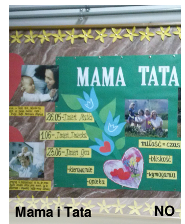
Mama i Tata NO