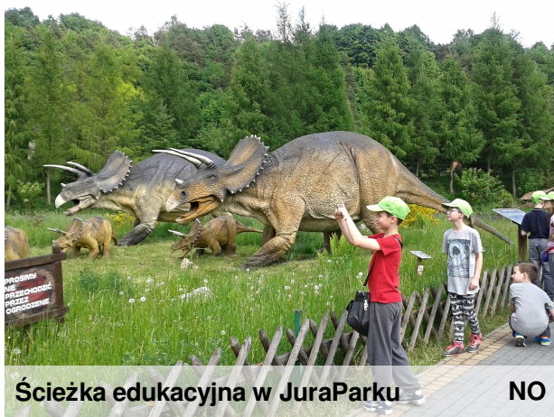
Ścieżka edukacyjna w JuraParku