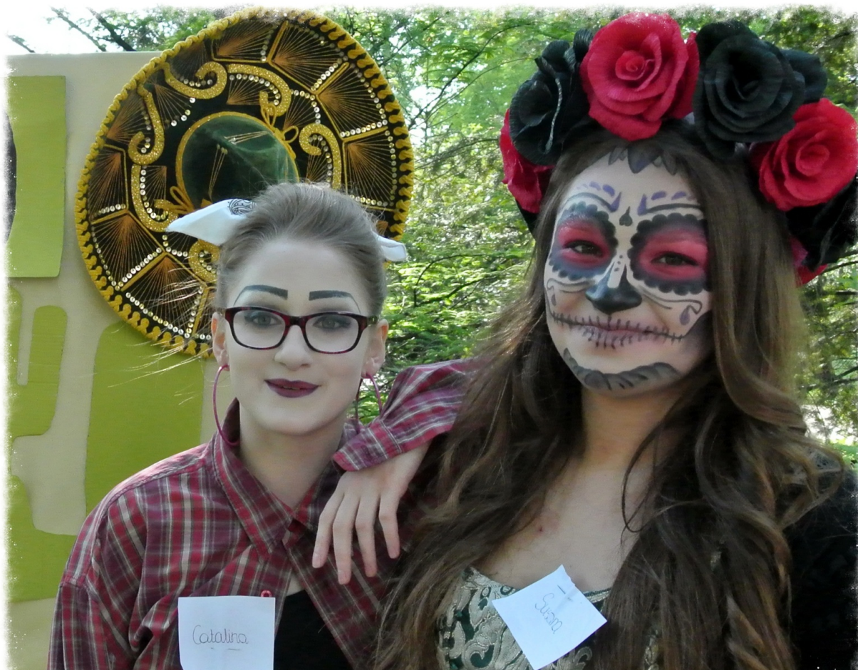
Chola girl i Śmierć w Meksyku

W ostatnich miesiącach pod egidą Unesco zorganizowaliśmy wiele akcji. Był to Światowy Dzień Książki, podczas którego odbył się wykład HISTORIA KSIĄŻKI. Poznaliśmy genezę pisma i druku oraz zapoznaliśmy się z rozwojem i zmianą kształtu książki, od genezy pisma i naskalnych rysunków człowieka pierwotnego po opartą na e-bookach współczesność. Światowy Dzień Książki i Praw Autorskich obchodzony jest na całym świecie 23 kwietnia. Data ta została wybrana jako symboliczna, bowiem w tym dniu 1616r. zmarli Miguel de Cervantes, William Szekspir i Inca Garcilaso de la Vega. Na ten sam dzień przypada rocznica urodzin lub śmierci innych pisarzy np. Vladimira Nabukova i Manuela Vallejo.