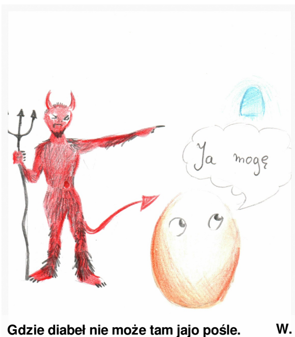
Gdzie diabeł nie może tam jajo pośle. W.