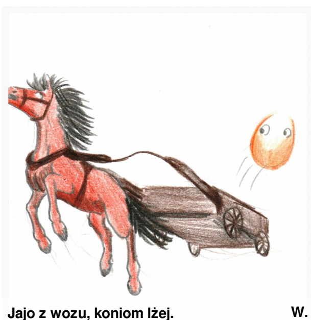
Jajo z wozu, koniom lżej. W.

Z OKAZJI DNIA DZIECKA ŻYCZYMY WAM SAMYCH UŚMIECHÓW I SPEŁNIENIA