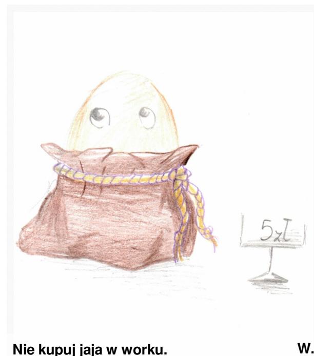
Nie kupuj jaja w worku. W.