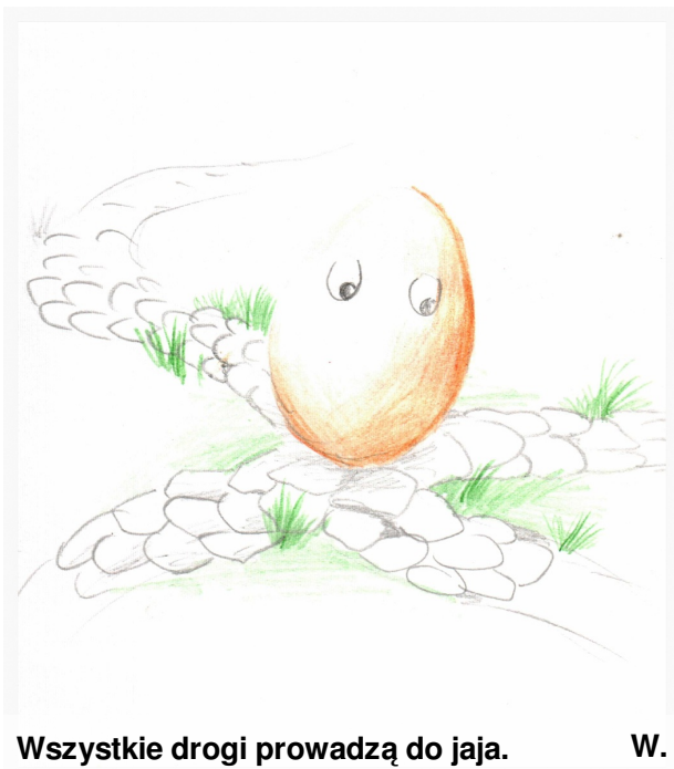
Wszystkie drogi prowadzą do jaja. W.