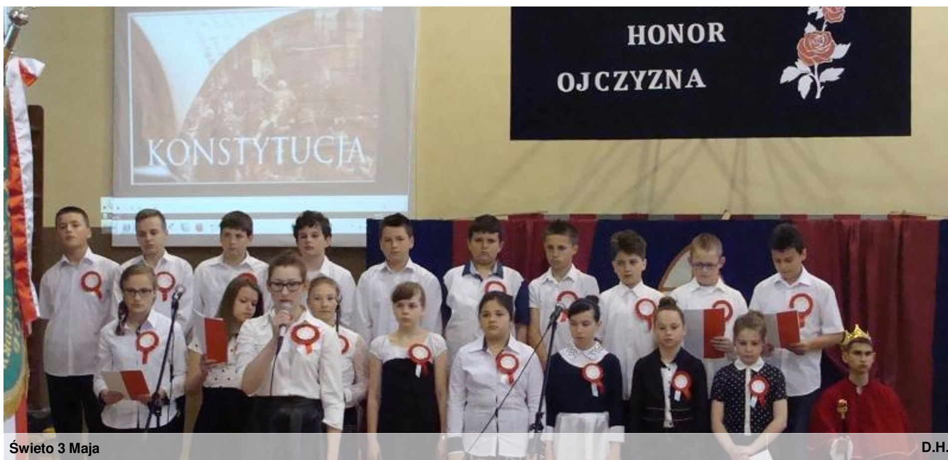
Święto 3 Maja