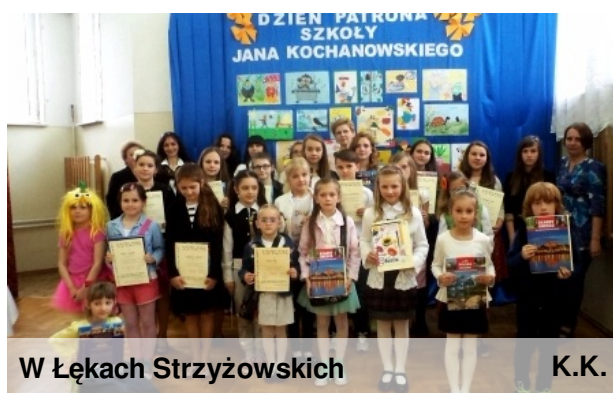
W Łękach Strzyżowskich