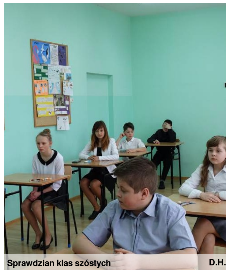
Sprawdzian klas szóstych

1 kwietnia, uczniowie klas szóstych szkoły podstawowej napisali pierwszy w swoim życiu poważny test - sprawdzian. W tym roku po raz pierwszy odbył się w nowej formule, składał się z dwóch części. Uczniowie przez 80 minut wypełniali test umiejętności i wiadomości dotyczących języka polskiego, matematyki z elementami przyrody i historii, a po przerwie rozpoczęła się druga część egzaminu obejmująca język angielski.