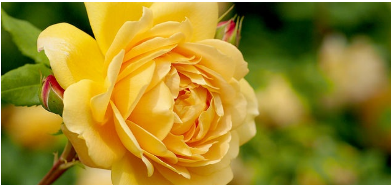
Róża jest symbolem książki