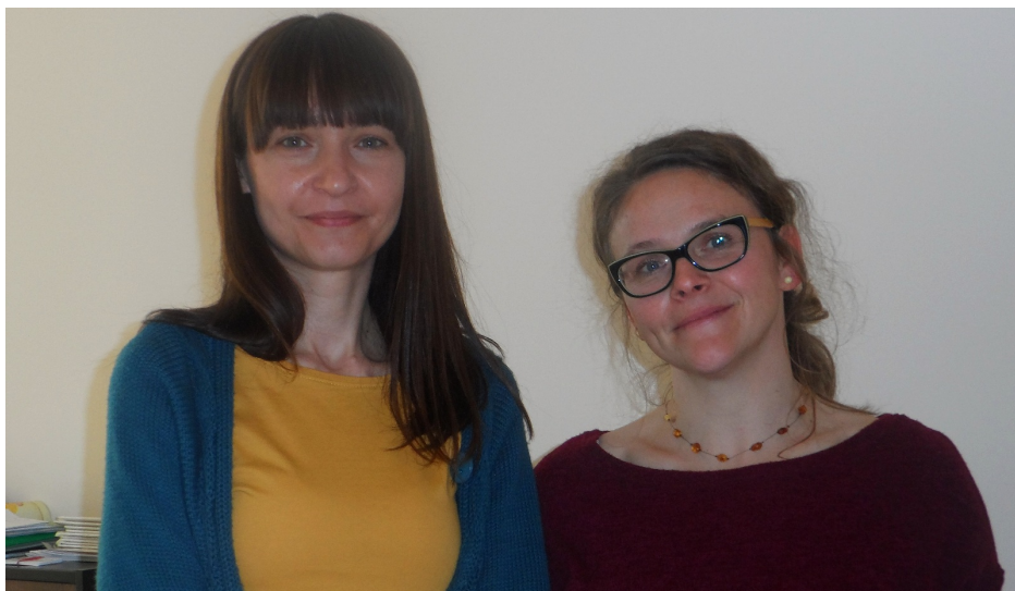
Nasze ekspertki - panie z PPP w Pruszczu Gdańskim