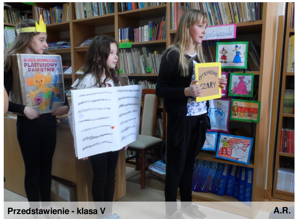
Przedstawienie - klasa V