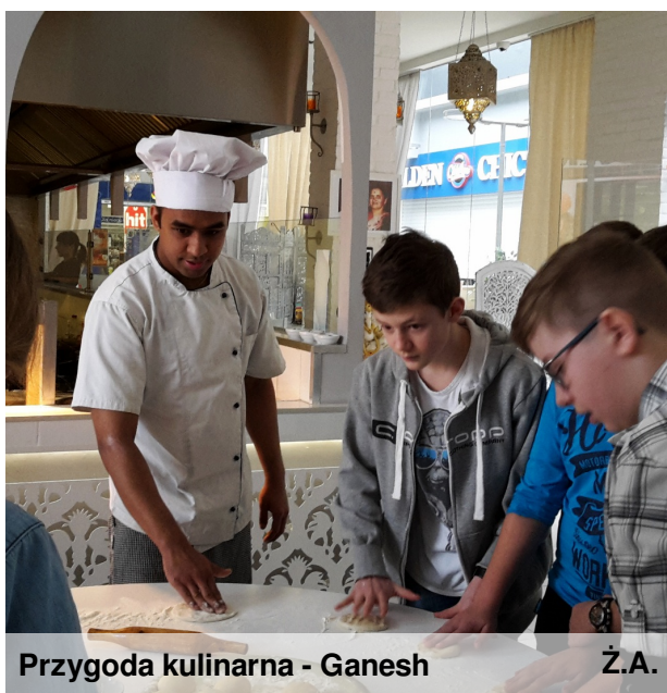
Przygoda kulinarna - Ganesh