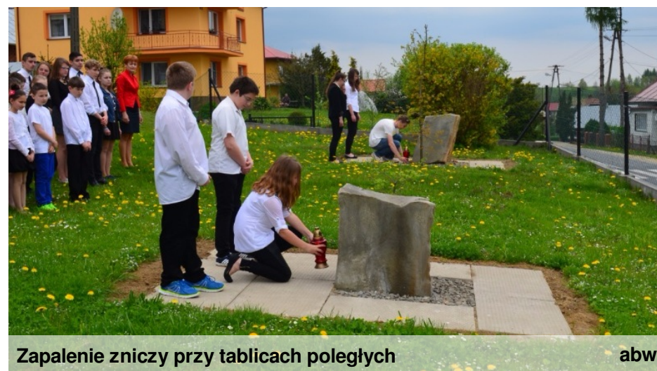
Zapalenie zniczy przy tablicach poległych