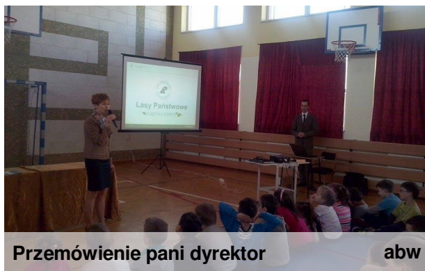
Przemówienie pani dyrektor abw

Na koniec spotkania rozstrzygnięto konkurs plastyczny "Drzewa naszych lasów" oraz multimedialny "Przyjaciel Lasu".