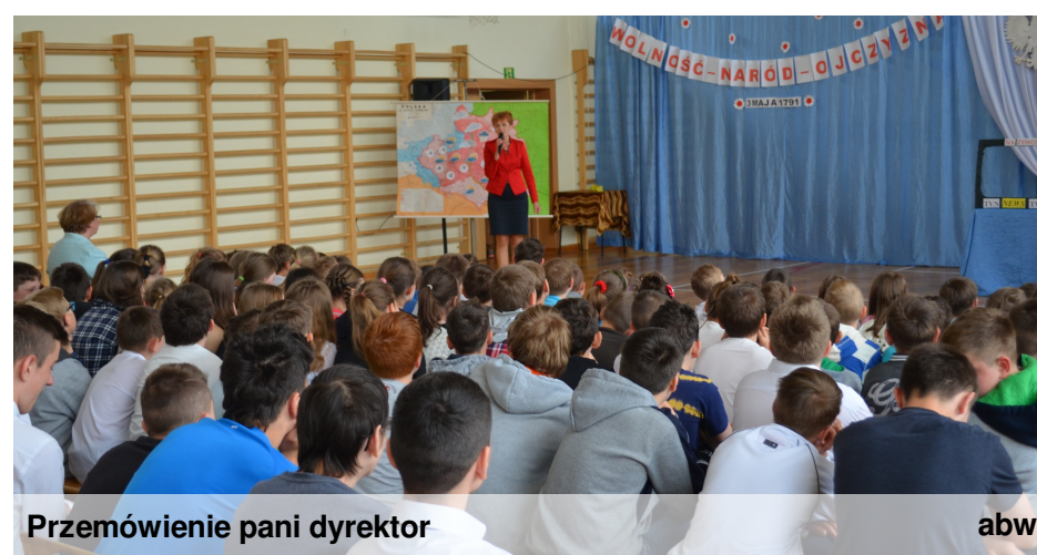
Przemówienie pani dyrektor