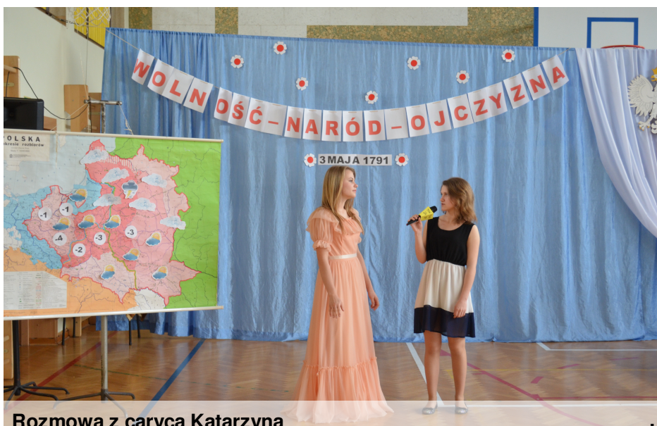
Rozmowa z carca Katarzyna