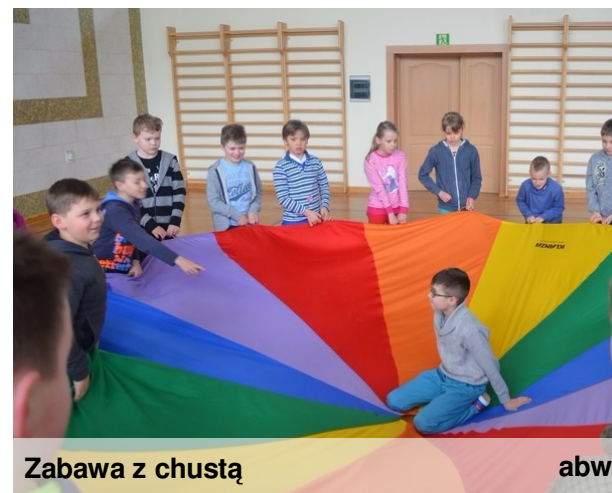
Zabawa z chustą abw