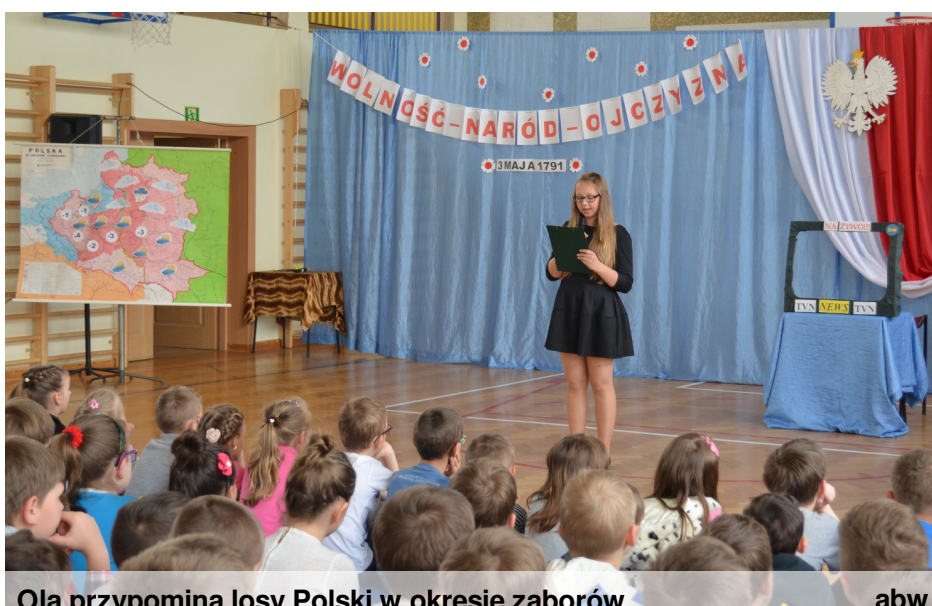
Ola przypomina losy Polski w okresie zaborów