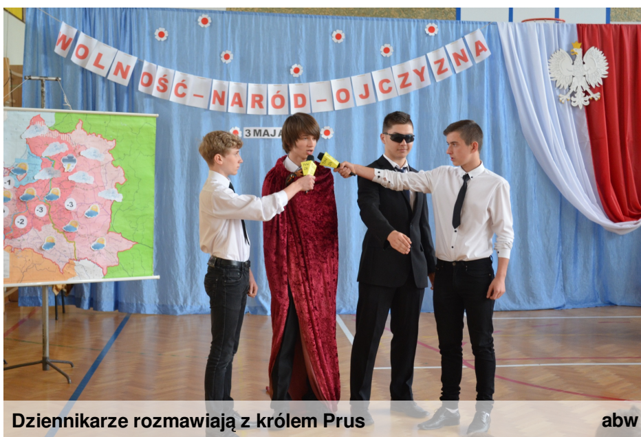
Dziennikarze rozmawiają z królem Prus