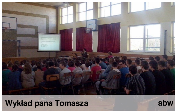
Wykład pana Tomasza abw