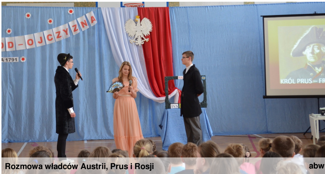
Rozmowa władców Austrii, Prus i Rosji