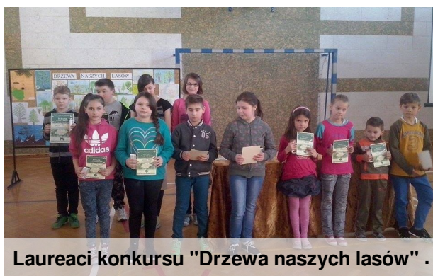
Laureaci konkursu "Drzewa naszych lasów".