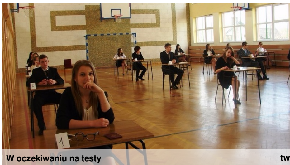
W oczekiwaniu na testy tw