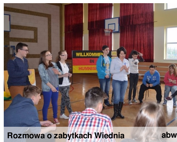
Rozmowa o zabytkach Wiednia abw