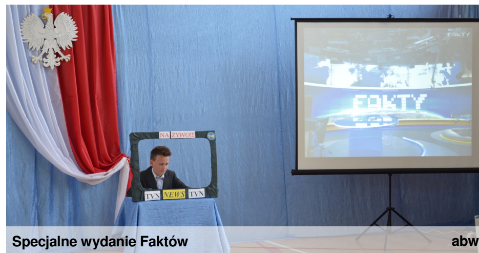
Specjalne wydanie Faktów