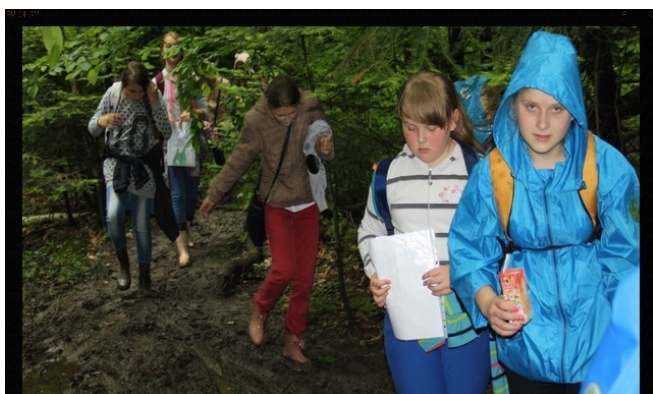
Czasem było ciężko...