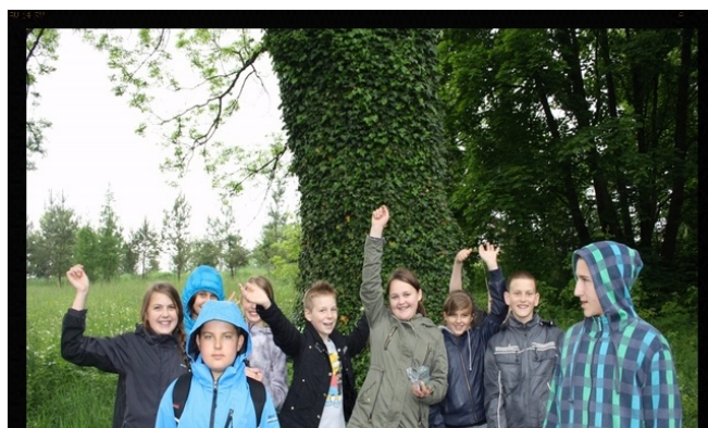
...ale dobry humor nas nie opuszczał!