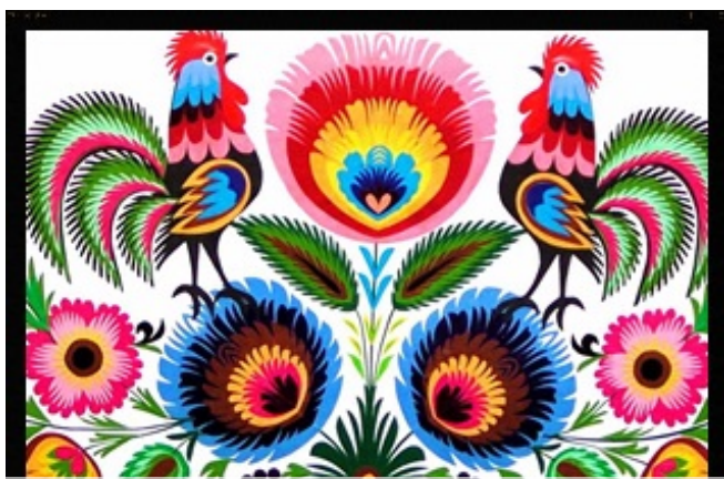
Z OSIŃSKIEJ GWARY: