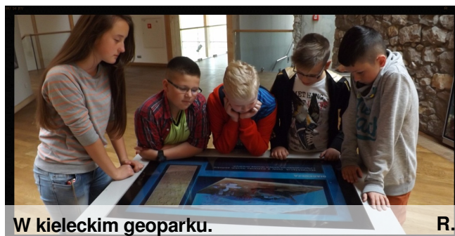
W kieleckim geoparku.