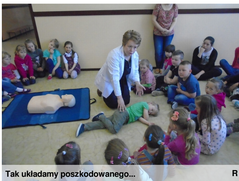
Tak układamy poszkodowanego...