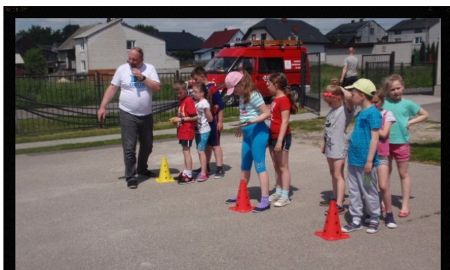
Gry i zabawy na szkolnym boisku.