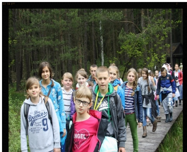
Na leśnym szlaku.