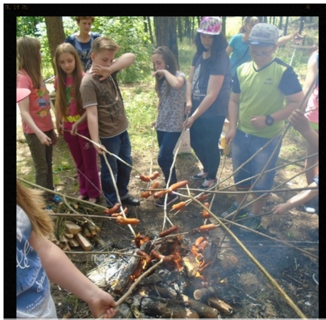
Wspólne ognisko młodych poszukiwaczy.

At school we celebrated Children's Day. Young children played with their teachers in the school playground. They danced and took part in sports competitions. Older pupils went to the nearby forest where they looked for a hidden treasure. After this interesting game they had a picnic with a campfire. It was a fantastic day!