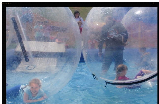
Szaletstwa w parku rozrywki.