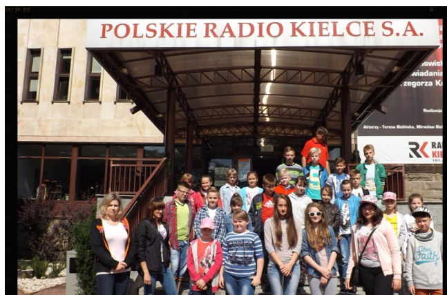
Przed siedzibą Radia Kielce.