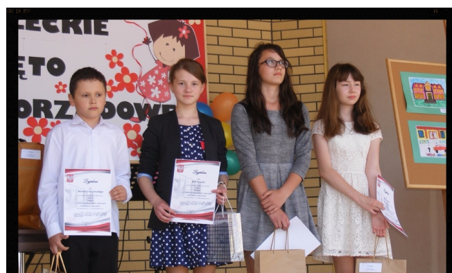
Nasza redakcyjna koleżanka z nagrodą.