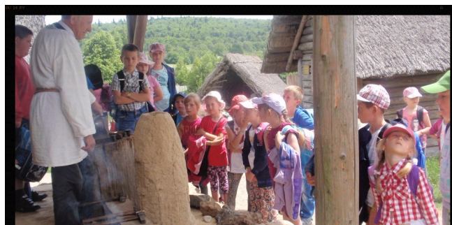
W średniowiecznej osadzie.

Uczniowie klas starszych wybrali się na wyprawę do Kielc. Najpierw odwiedzili rozgłośnię „Radia Kielce”. Zwiedzili pokoje reżyserów dźwięku oraz studia nagraniowe. Z zainteresowaniem słuchali przewodniczki, która opowiadała o historii radia oraz powstawaniu programów i audycji radiowych. Ciekawość wzbudziła również ekspozycja starych odbiorników radiowych. Później wycieczkowa grupa zagościła na kilka godzin w „Geoparku” na kieleckiej Wietrzni. Uczniowie poznali proces narodzin życia na naszej planecie oraz geologiczne dzieje Kielecczyny. Wielu emocji dostarczyła wirtualna podróż do jądra Ziemi w specjalnej „kapsule czasu”. Na zakończenie pobytu odbyły się warsztaty, w czasie których dzieci szlifowały płytki wapienia tworząc dla siebie oryginalne pamiątki z wyprawy. Jeszcze tylko łasuchowanie w „McDonaldzie” i gwarny, roześmiany powrót do Osin.