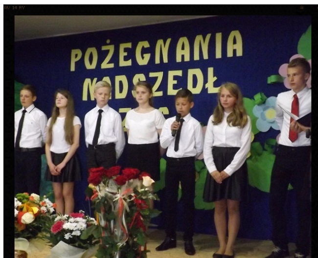
Ostatni występ na szkolnej scenie.