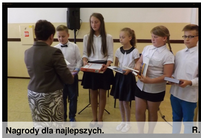
Nagrody dla najlepszych.