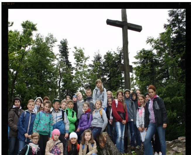
U stóp Świętego Krzyża

Codzienne relacje ze swoich wędrówek uczniowie zamieszczali na profilu Facebooka. Popołudnia i wieczory to nie tylko nauka i praca. Był również czas na relaks i dobrą zabawę. Dyskoteka, ognisko ze wspólnymi śpiewami przy gitarze, nowe znajomości – wszystko to doskonale zintegrowało uczniów z obu szkół.