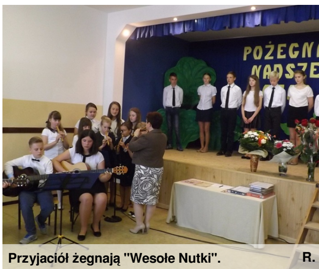
Przyjaciół żegnają "Wesołe Nutki".