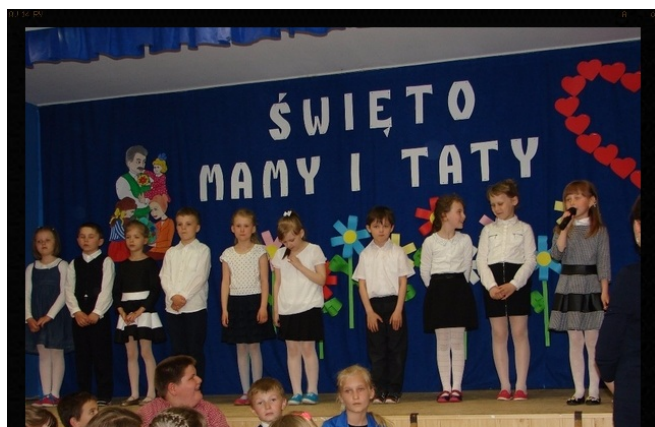
Wiersze i piosenki dla Mam i Tatusiów