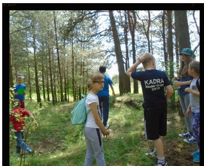
Poszukiwanie skarbu - gra terenowa.