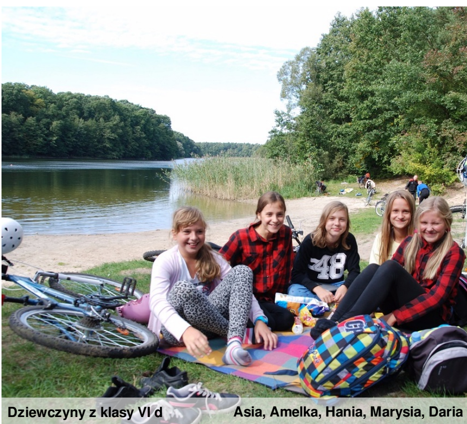
Dziewczyny z klasy VI d