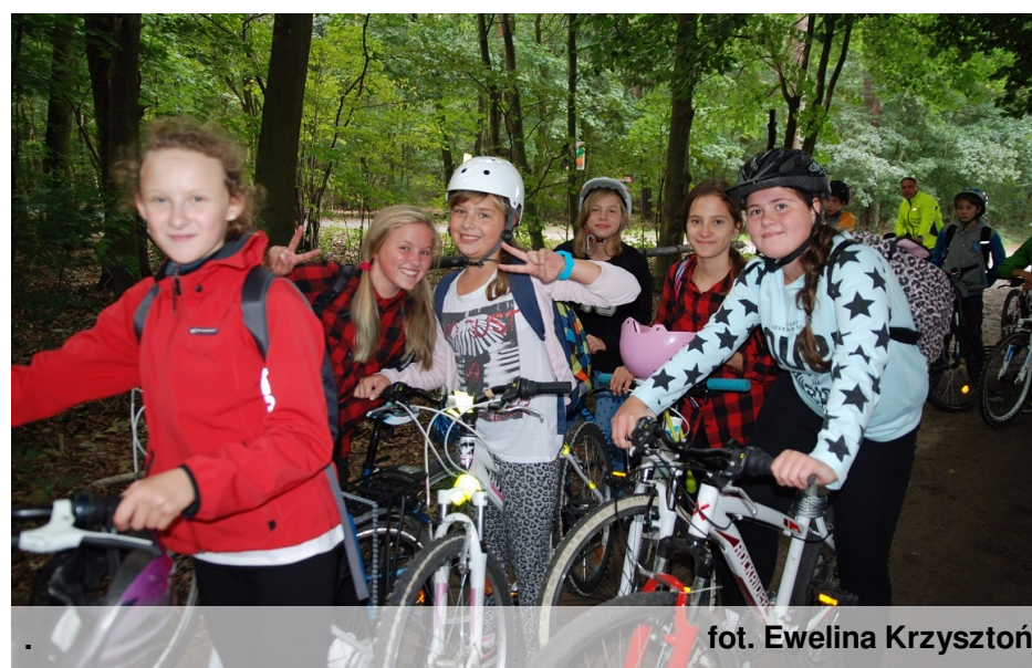
fot. Ewelina Krzysztoń