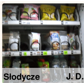
Słodycze J. D.