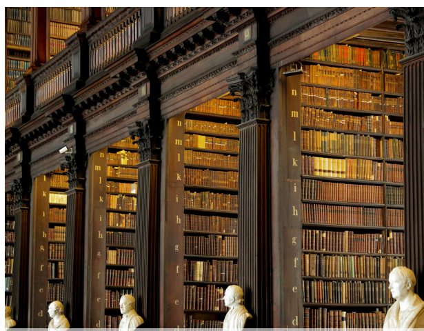
Biblioteka w Dublinie Julia Dziechciarz