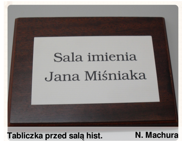
Tabliczka przed salą hist.