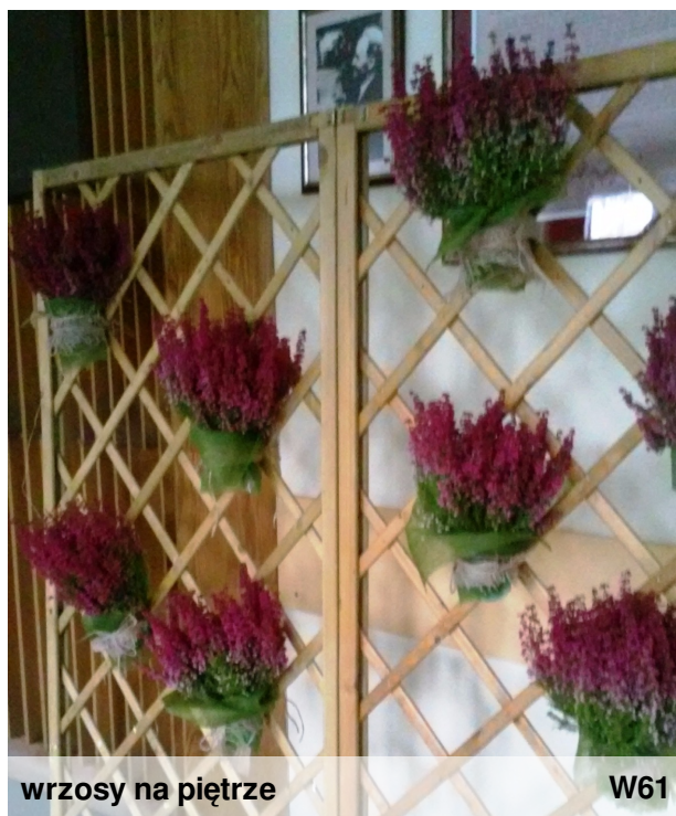
wrzosy na piętrze