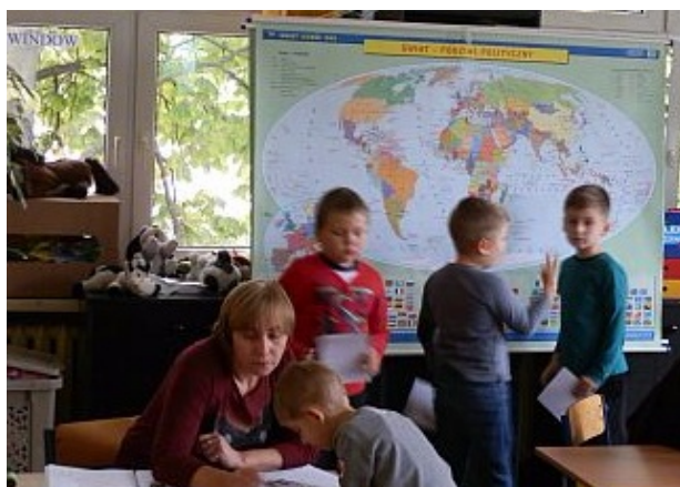
gra uczy Wb61