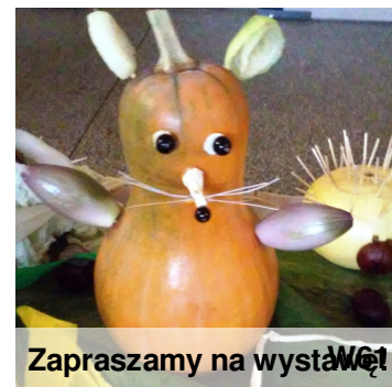
Zapraszamy na wystawęW61

Jak zawsze jesienią na korytarzu szkolnym pojawiły się niezwykle zwierzaki wyczarowane z jarzyn i owoców. Wyobraźnia uczniów nie zna granic, a jedynym przeciwnikiem jest czas... Zdarza się, że dzieła sztuki schną i więdną. Zapraszamy do galerii str. 5