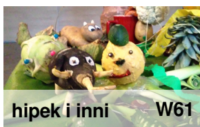
hipek i inni