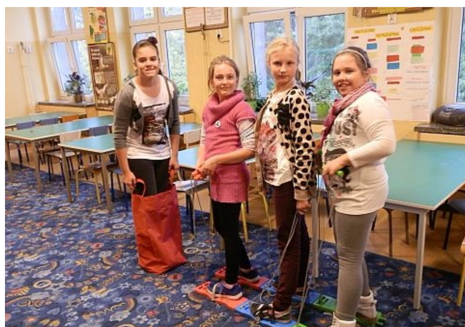
w ruchu Wb61