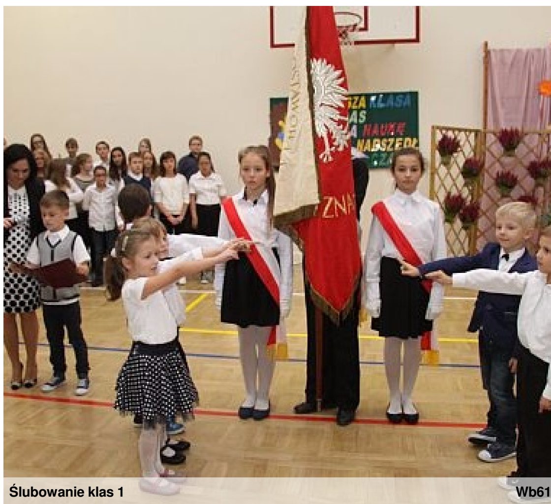
Ślubowanie klas 1