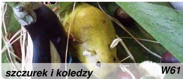
szczurek i koledzy