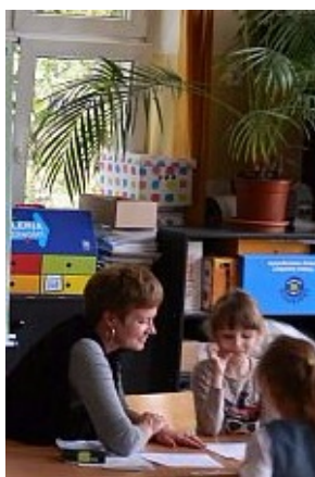
gra uczy Wb61