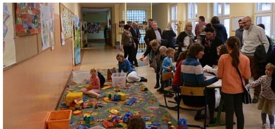
gry dla dzieci Wb61