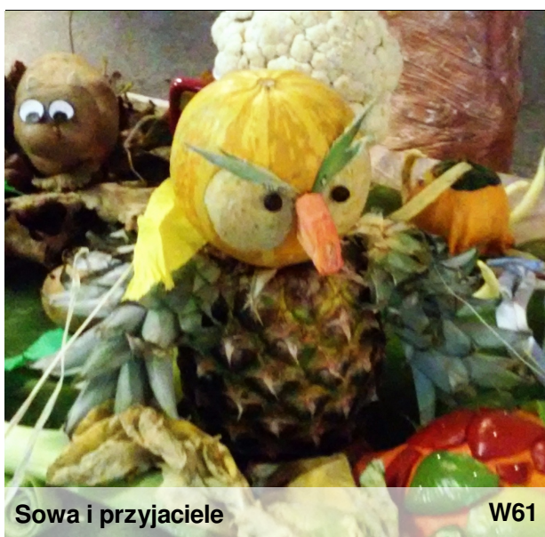
Sowa i przyjaciele

Znamy już plany Samorządu na ten rok szkolny. Będzie sporo imprez, a najbliższa to zabawny dzień przebierańców 30 października. Będzie też patriotyczny Dzień Biało-Czerwony 10 listopada.