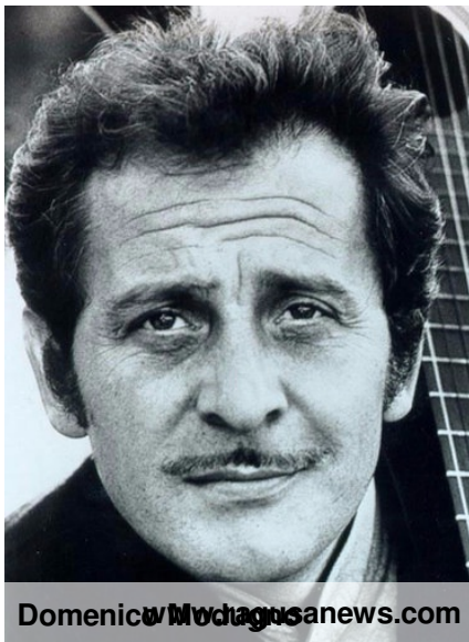
Domenico Modugno news.com