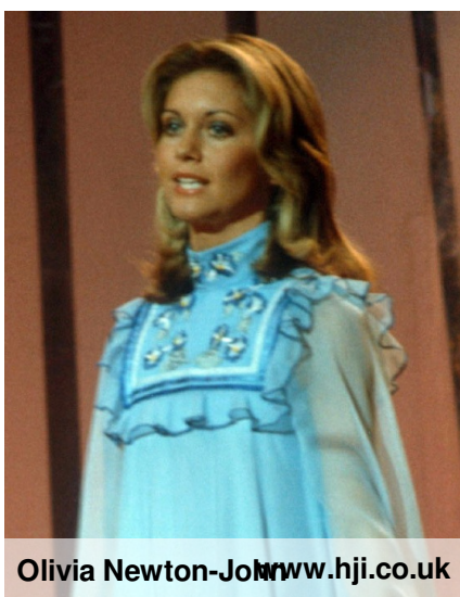
Olivia Newton-John