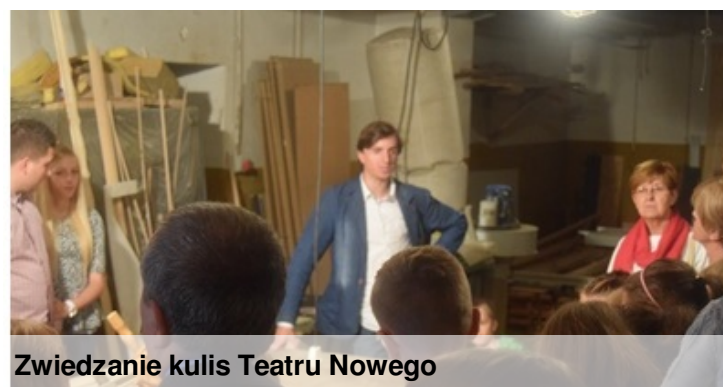
Zwiedzanie kulis Teatru Nowego