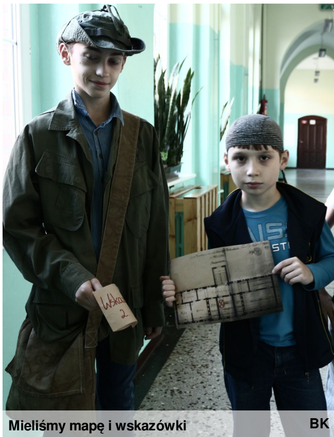
Mieliśmy mapę i wskazówki