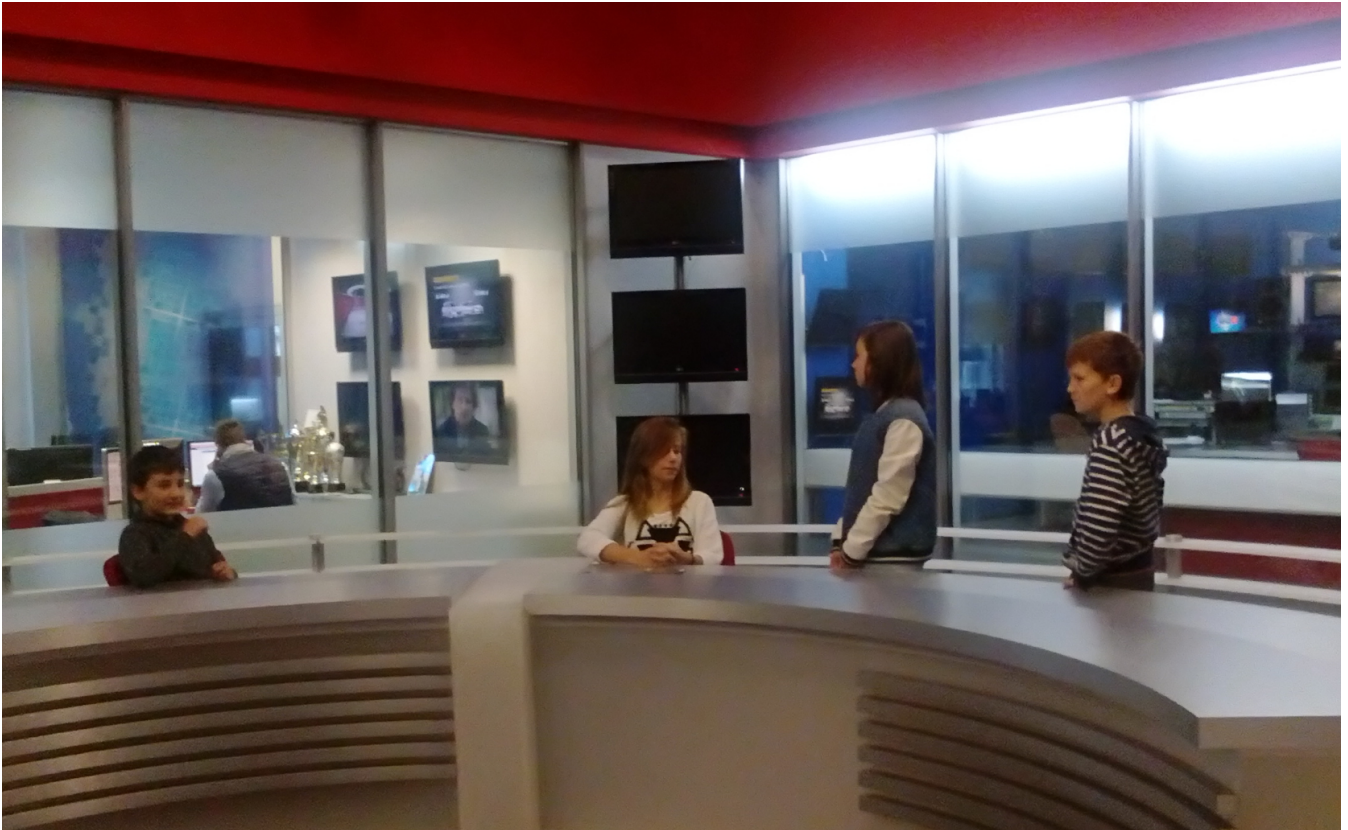
Wcielamy się w rolę prezentera