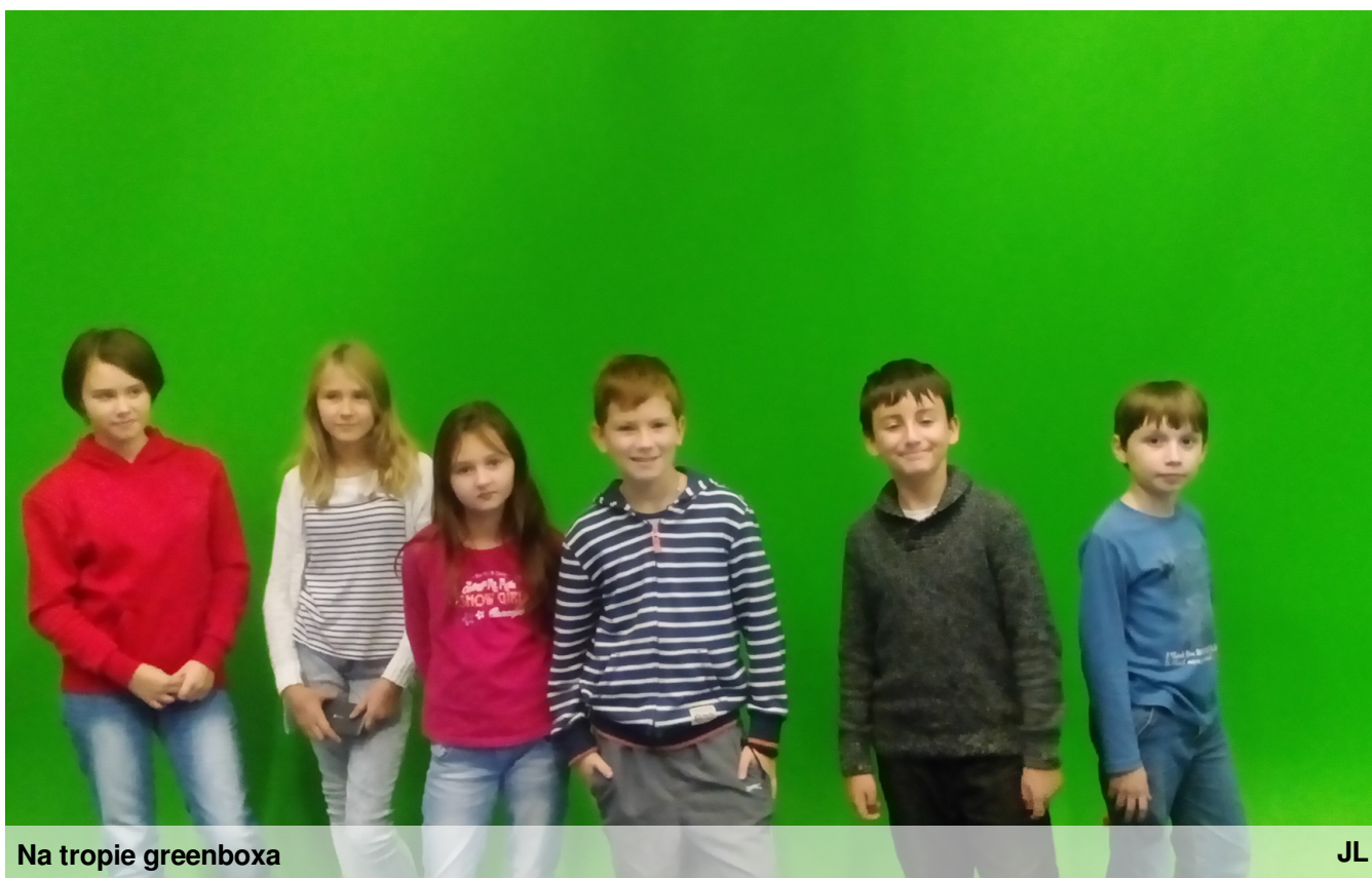
Na tropie greenboxa