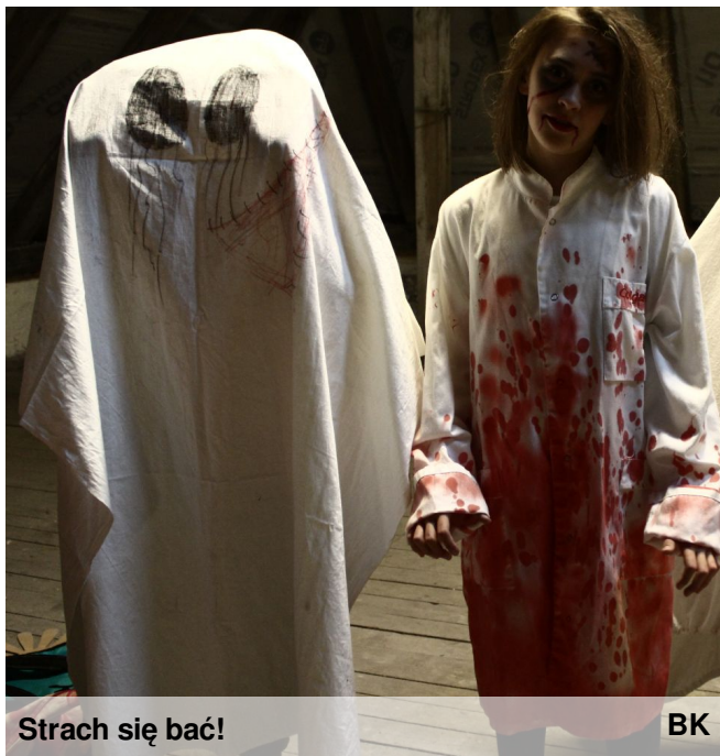
Strach się bać!