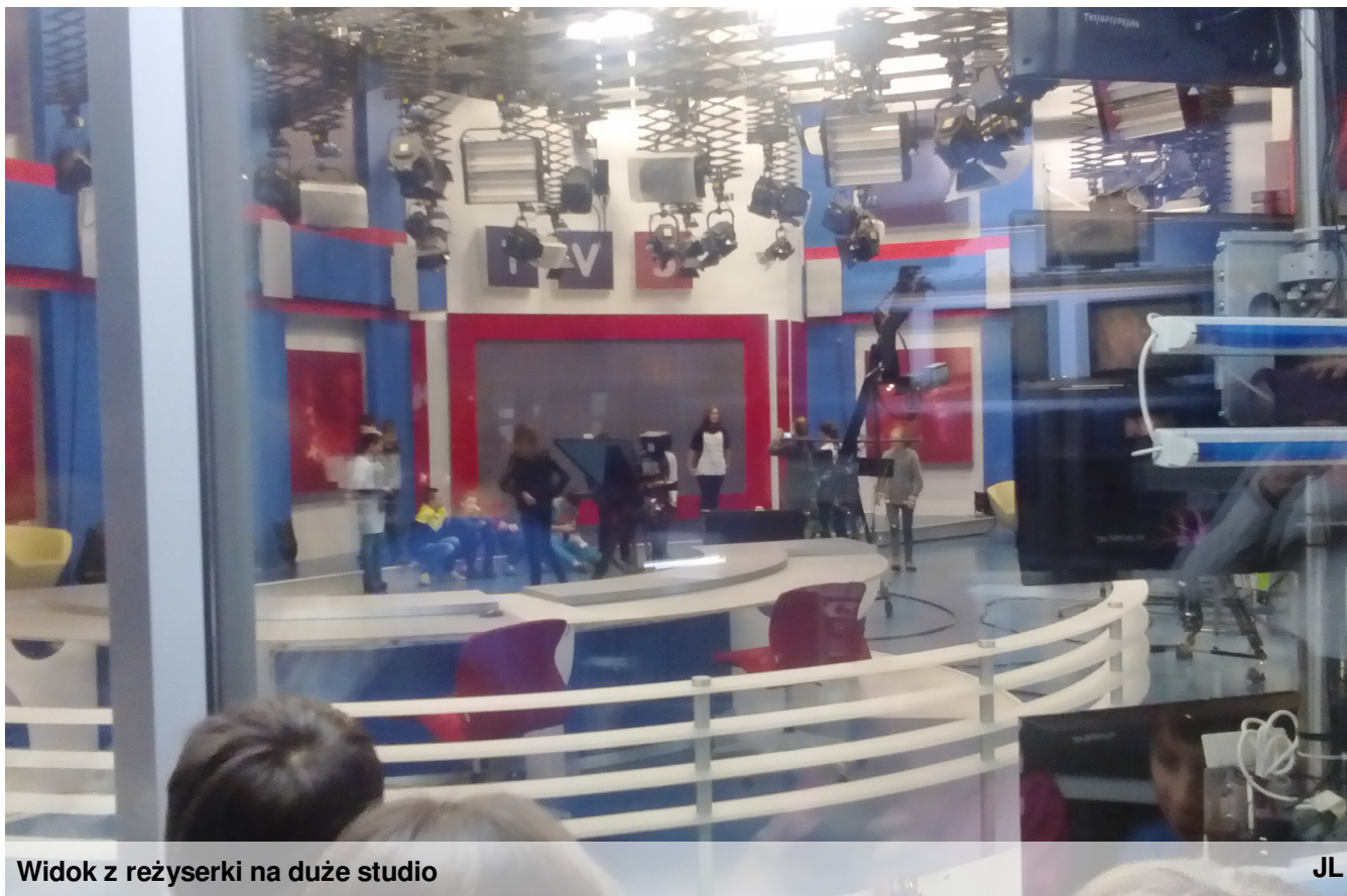
Widok z reżyserki na duże studio