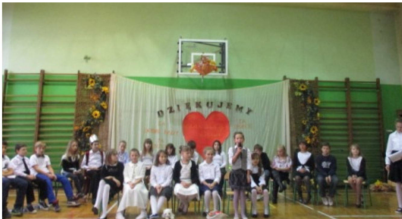
Uroczysta akademia na Dzień Nauczyciela