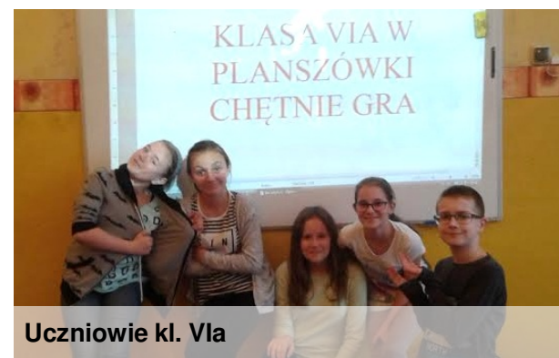
Uczniowie kl. VIa

O zaletach gier planszowych wie chyba każdy. Wystarczy wspomnieć, że dostarczają wiele pozytywnych emocji, rozwijają i świetnie integrują grupę. Dlatego też uczniowie klasy VIa tak lubią od czasu do czasu spotkać się po lekcjach i pograć. Doskonale jednak wiemy, że wśród uczniów naszej szkoły jest więcej miłośników "gier bez prądu", dlatego też samorząd uczniowski już planuje takie spotkania dla wszystkich chętnych. Jak zapewniamy organizatorzy, szczegóły zostaną przedstawione już niedługo, a wszystkie pytania w tej sprawie możecie kierować do pana Krzysztofa Noconia.