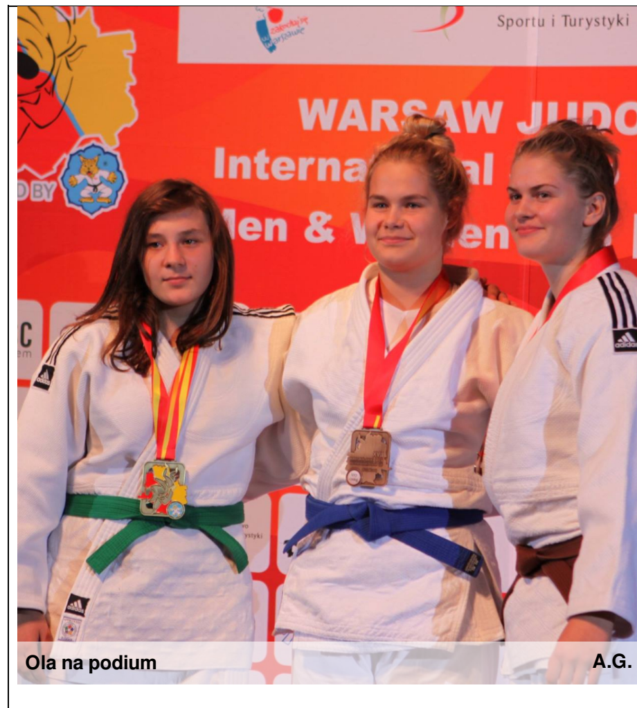
Ola na podium

Wywiad przeprowadziły: Patrycja i Iza z IIIb