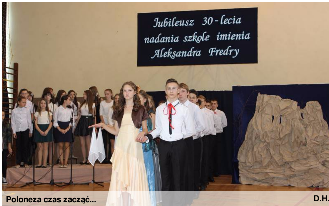
Poloneza czas zacząć...

Patron - to bardzo ważna postać w życiu placówki oświatowej. Wokół niej buduje się tradycje, wprowadza uczniów w świat wartości. W czasach, kiedy notujemy upadek autorytetów, wybór patrona to trudne zadanie.