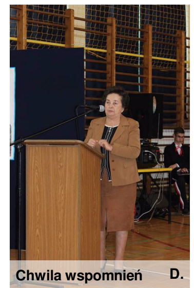
Chwila wspomnień D.