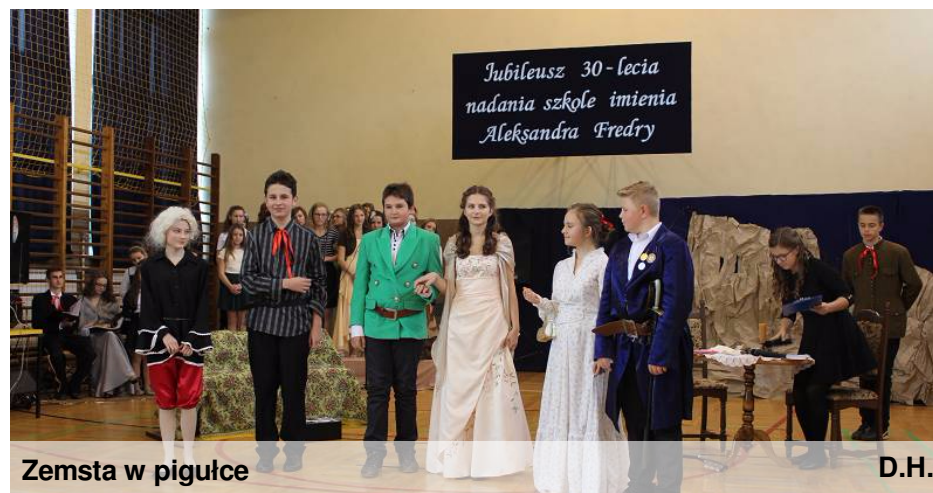
Zemsta w pigułce