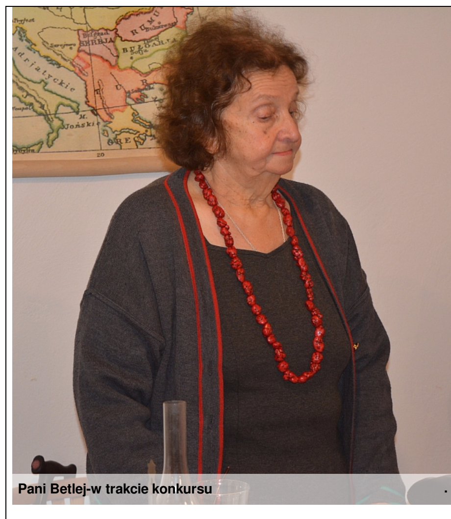
Pani Betlej-w trakcie konkursu