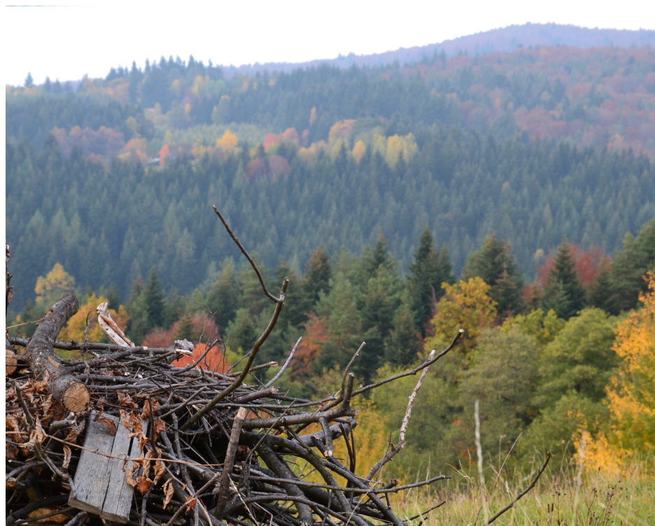
Ognisko czas zacząć