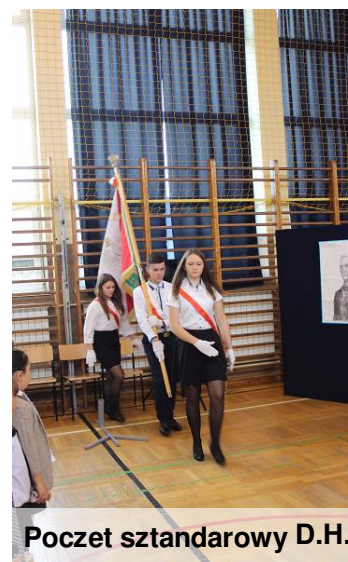
Poczet sztandarowy D.H.