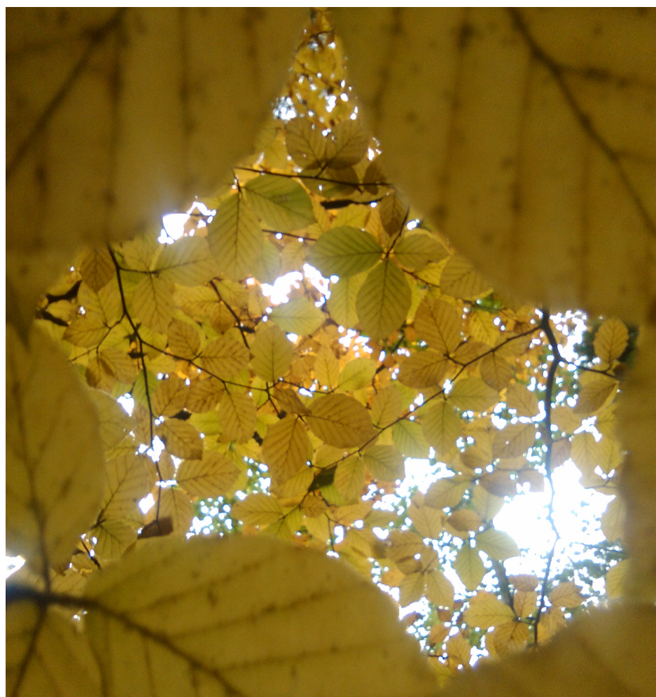
Przez dziurkę od...liścica