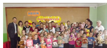
Święto Misia M. Miąc