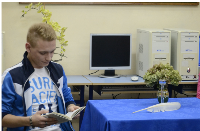
Zwycięzca - "Szachinszach"