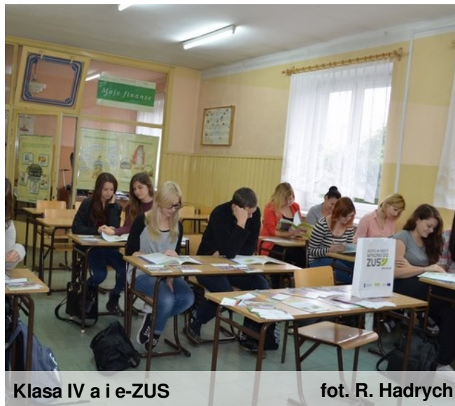
Klasa IV a i e-ZUS