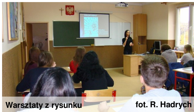
Warsztaty z rysunku