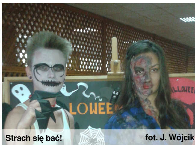
Strach się bać!