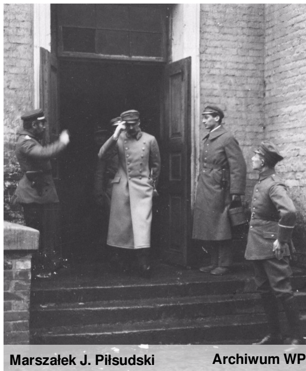
Marszałek J. Piłsudski