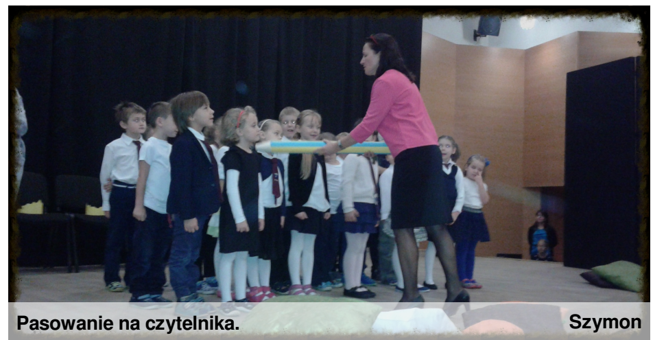
Pasowanie na czytelnika.