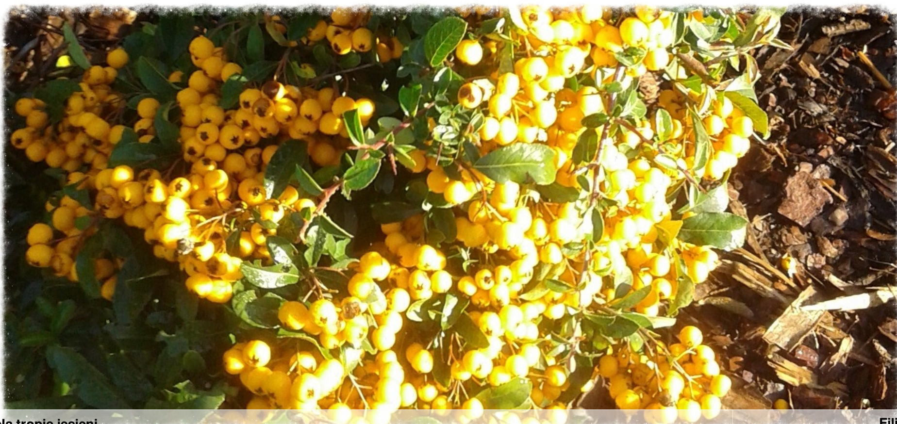
Na tropie jesieni.