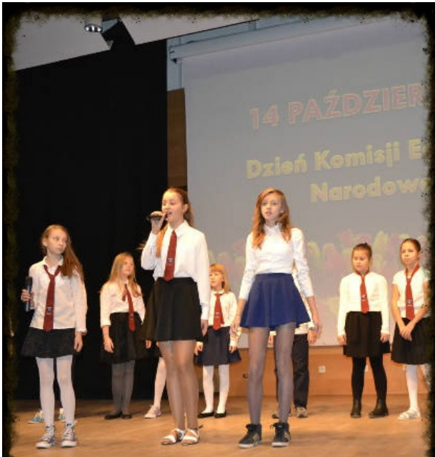
Dzień Edukacji Narodowej.