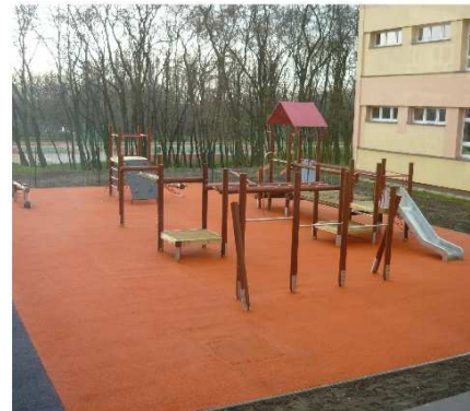
To nasz nowy plac zabaw

Na terenie naszej szkoły wybudowano nowy plac zabaw. Nie wiadomo jeszcze kiedy będzie udostępniony dla dzieci, ale już wszyscy się cieszą, bo zabawa na nim pewnie będzie super. emi