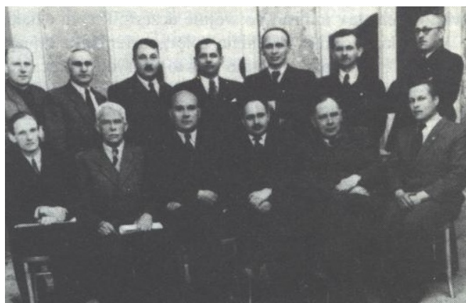
Kierownictwo TON u