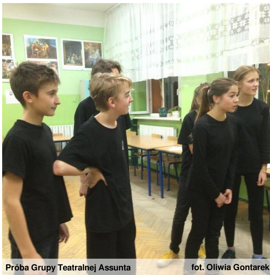
Próba Grupy Teatralnej Assunta