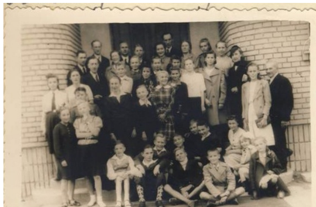
Nauczyciele i uczniowie