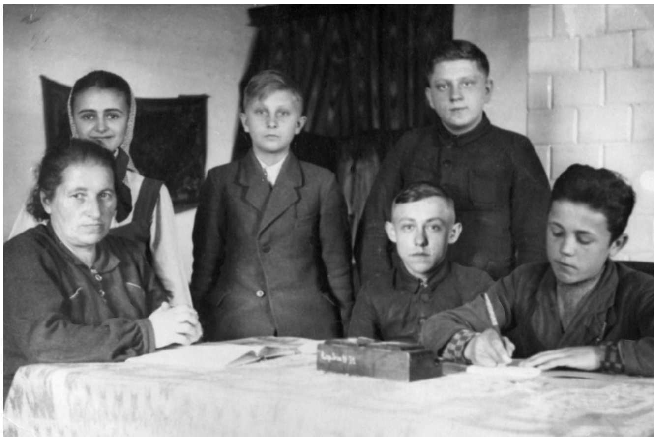
Lekcja języka polskiego podczas tajnych kompletów.