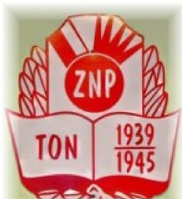
Tajna Organizacja Nauczycielska