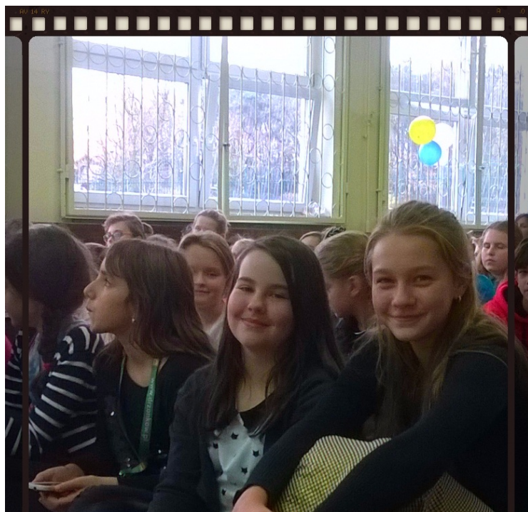
Byliśmy tam :)