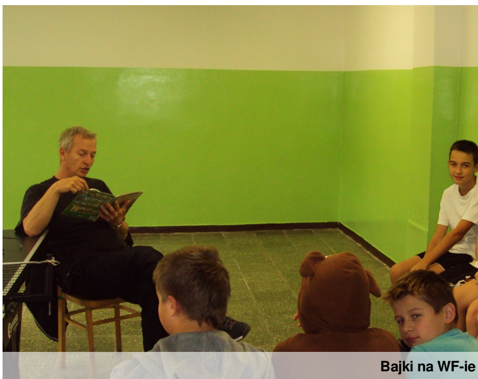
Bajki na WF-ie