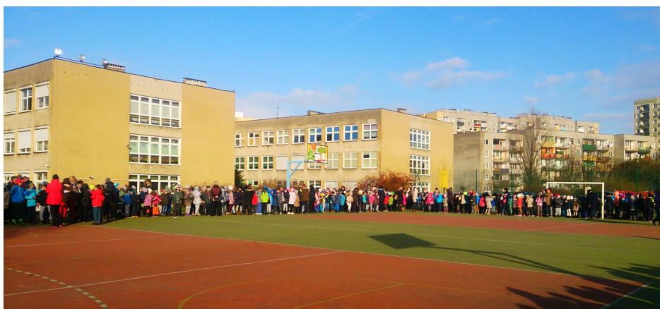
30 XI - próba ewakuacji szkoły

24 listopada uczniowie klas VI napisali drugi próbny test przed sprawdzianem szóstoklasisty. Trwał od godziny 9 00 do 10 40 . Tym razem pisaliśmy go inaczej niż ostatnio - zostaliśmy bowiem podzieleni na siedemnaście sal. Taki sam podział będzie obowiązywał 5 kwietnia 2016 roku podczas głównego sprawdzianu.