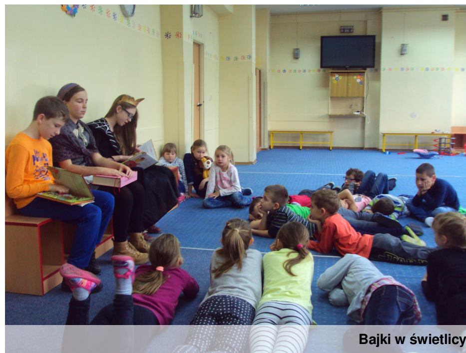
Bajki w świetlicy