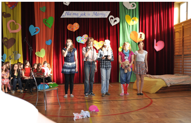
Jak nasza mama została królową