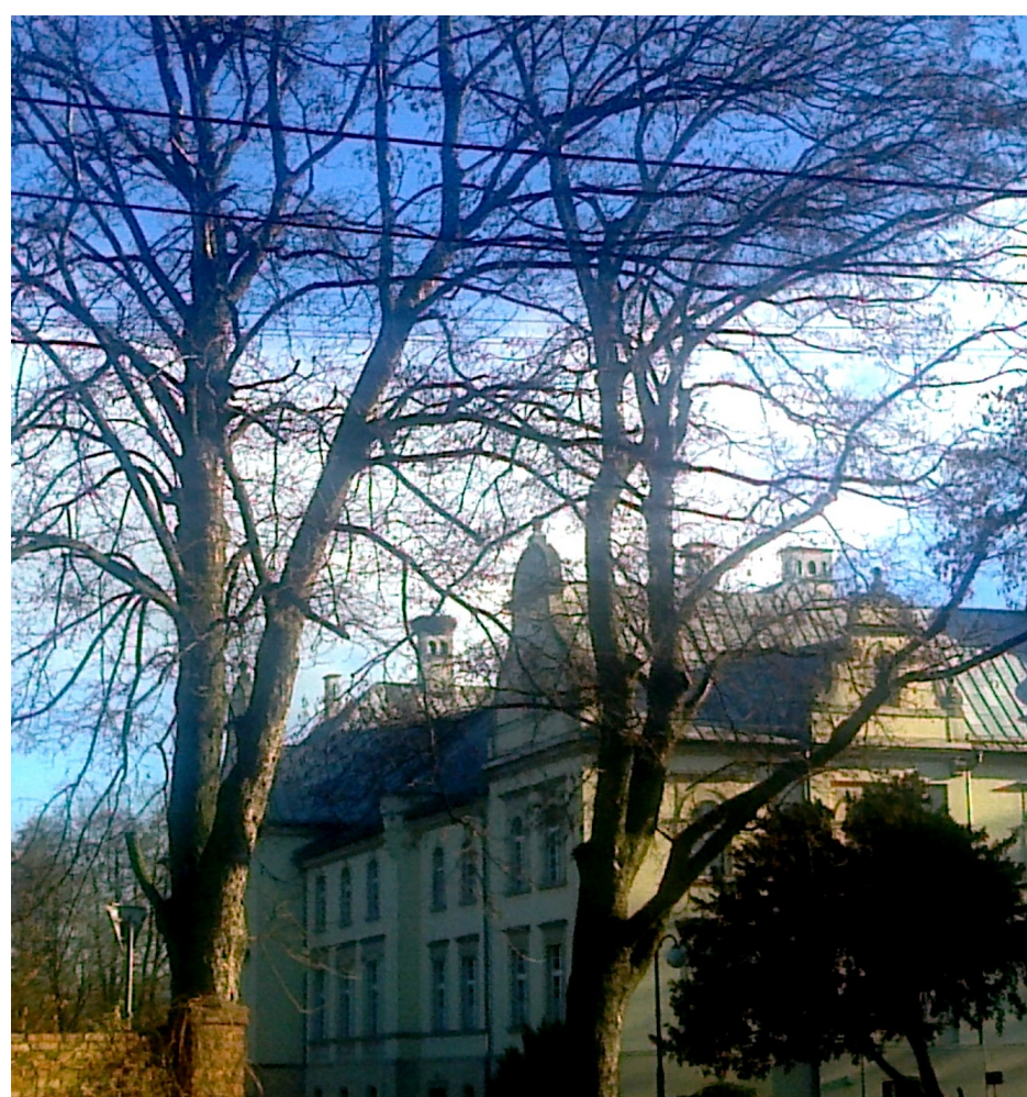
Pałac z XIX w. von Raczków w Przyszowicach