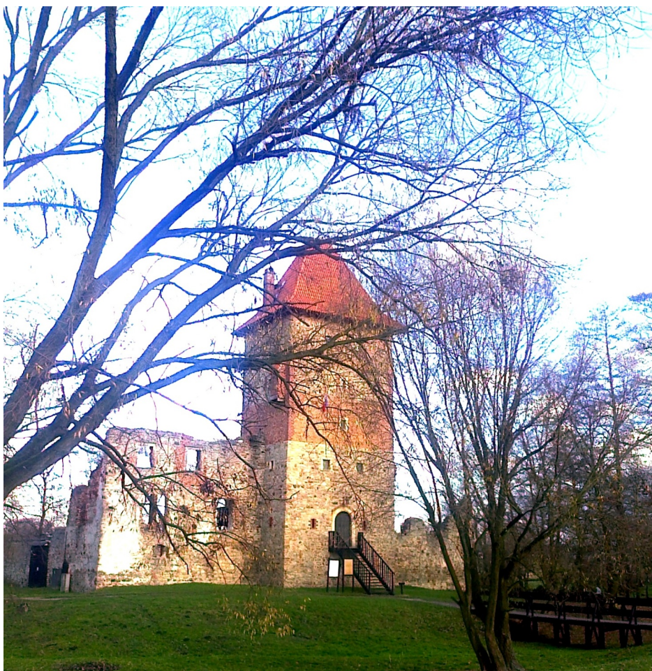
Zamek z XVI w. w Chudowie