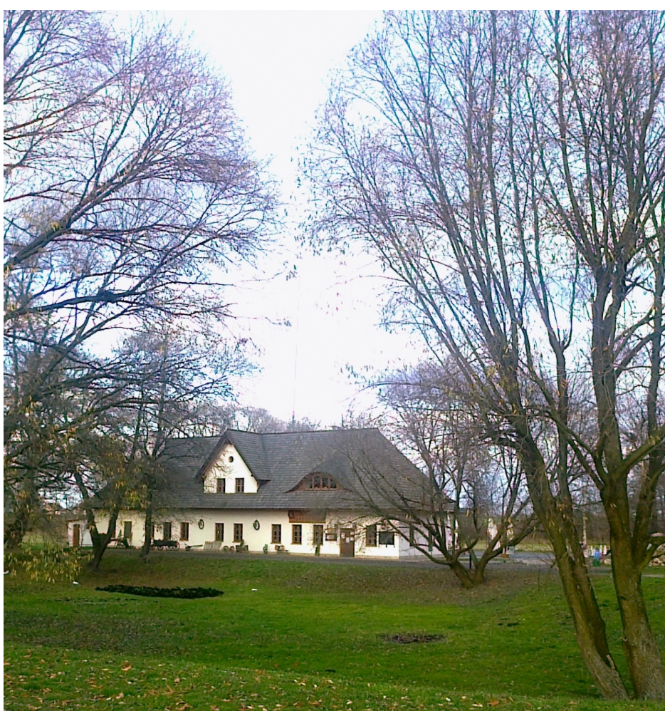
Karczma przy zamku w Chudowie