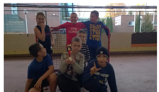
Legia Warszawa Ochota