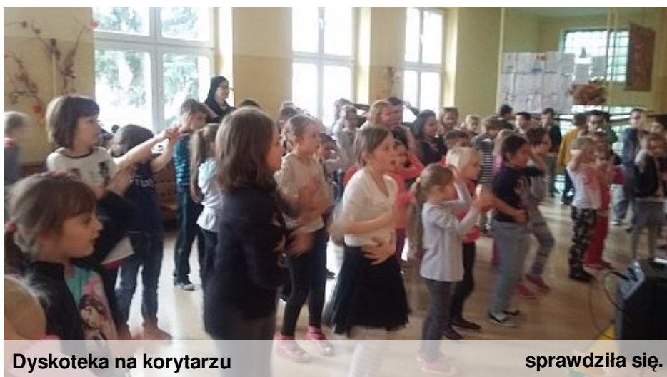
Dyskoteka na korytarzu