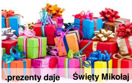
prezenty daje Święty Mikołaj