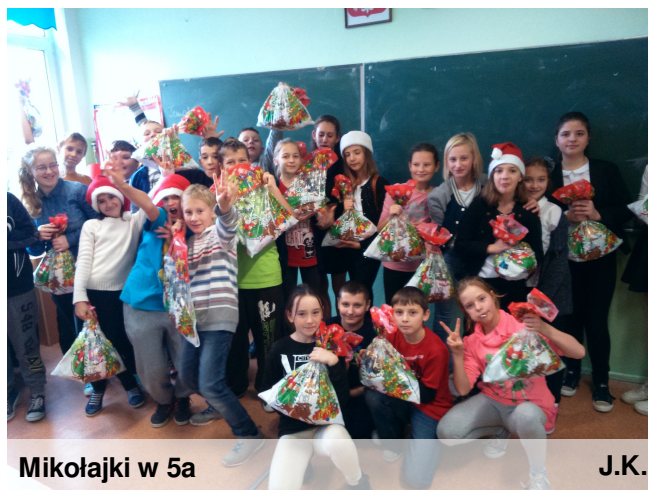
Mikołajki w 5a

W naszych paczkach było dużo słodczy oraz małe upominki. Przez większość lekcji zajmowaliśmy się prezentami, chwilę poświęciliśmy na ubieranie choinki. Rozmawialiśmy przy tym o tradycjach, które pielęgnujemy w okresie przedświątecznym.