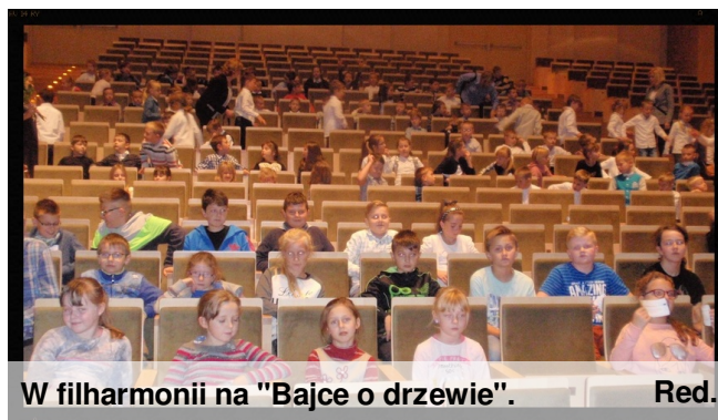
W filharmonii na "Bajce o drzewie". Red.

23 października uczniowie klas III-VI uczestniczyli w wycieczce do Kielc. Pierwszym punktem programu stała wizyta w Filharmonii Świętokrzyskiej. Dzieci obejrzały tam niezwykle „Bajkę o drzewie”. Literacka opowieść o historii pewnego drzewa, które marzyło, by stać się muzyką, ilustrowana była pokazem multimedialnym oraz przepięknymi utworami Beethovena, Mozarta i Czajkowskiego wykonywanymi przez muzyków Orkiestry Symfonicznej. Szwajcarska wiolonczelistka Astring Siranosian za swój niesamowity występ nagrodzona została przez młodą publiczność owacjami na stojąco. Uczniowie, poza artystycznymi doznaniem, wzbogacili swą wiedzę o muzyce i instrumentach muzycznych. Teraz przyszła pora na rozrywkę innego rodzaju. Zagościliśmy w kieleckiej „Planecie Klocków”. Pokaz filmu o historii klocków lego, samodzielne tworzenie kreowanych wyobrażeń budowli, emocje na ścianie wspinaczkowej i istne szaleństwo w trakcie walki ogromnymi poduchami – to wszystko sprawiło, że na nudę nikt nie mógł narzekać.