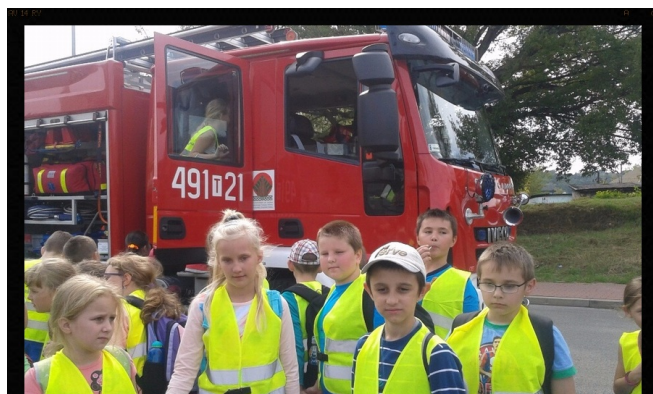
W trosce o bezpieczeństwo na drodze Red.

Zakładem odpowiedzialnym społecznie za akcję była Firma MAN, która zadbała również o bezpieczeństwo najmłodszych. Firma ufundowała dla wszystkich uczestników kamizelki odblaskowe, które dzieci są teraz zobowiązane nosić w drodze do i ze szkoły. Akcja realizowana była we współpracy z policją, redakcją „Transportu Polskiego” oraz Urzędem Miasta w Starachowicach. Na koniec organizatorzy wręczyli uczniom słodkie pominki.