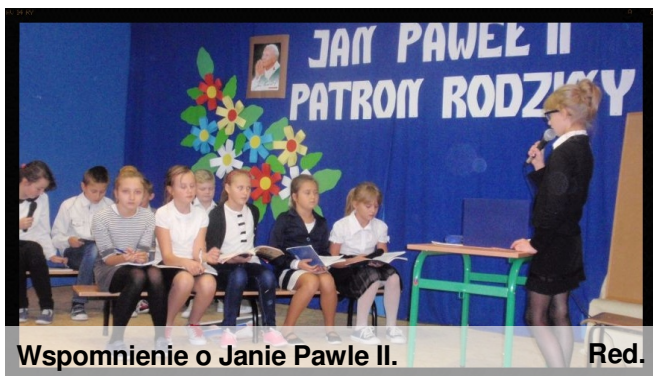
Wspomnienie o Janie Pawle II. Red.