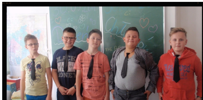
Chłopaki nie płaczą...