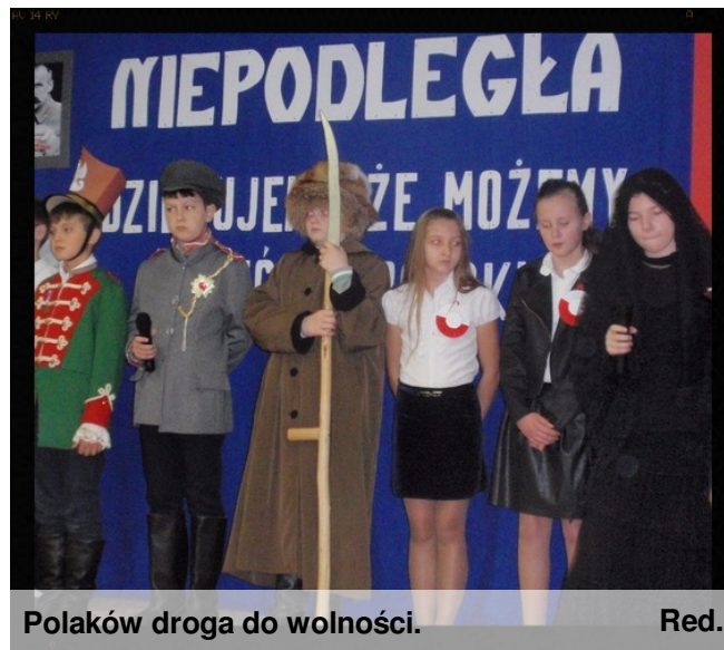
Polaków droga do wolności.