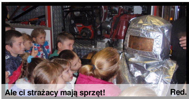
Ale ci strażacy mają sprzęt! Red.

Kolejną atrakcją wycieczki była wizyta w Komendzie Powiatowej Straży Pożarnej w Starachowicach. Gospodarze zapoznali dzieci ze swoim miejscem pracy oraz wytłumaczyli im, co to znaczy być strażakiem.. Uczniowie zwiedzili wszystkie budynki oraz obejrzeli wiele specjalistycznego sprzętu, jakim strażacy posługują się w swojej codziennej pracy. Najwięcej emocji wzbudziła symulacja alarmu. Dzieci z podziwem przyglądały się, jak sprawnie i szybko pracownicy straży reagują na zagrożenie pożarem.