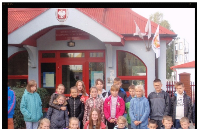
Dzień Chłopaka u strażaków.