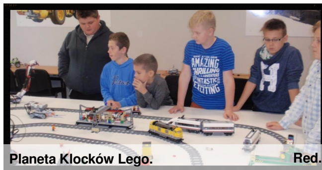
Planeta Klocków Lego. Red.