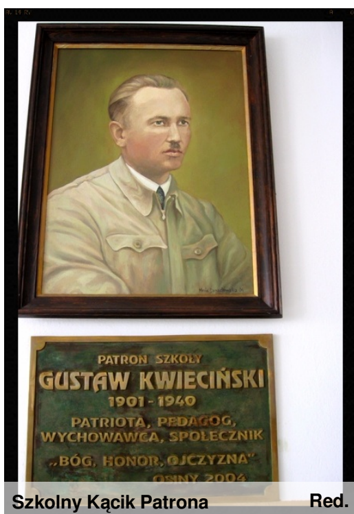
Szkolny Kącik Patrona

My, na szczęście, żyjemy w czasach, w których panuje pokój. Pamiętamy jednak o tamtych dramatycznych wydarzeniach i ludziach, którzy przelewali krew i oddawali za wolny kraj życie.