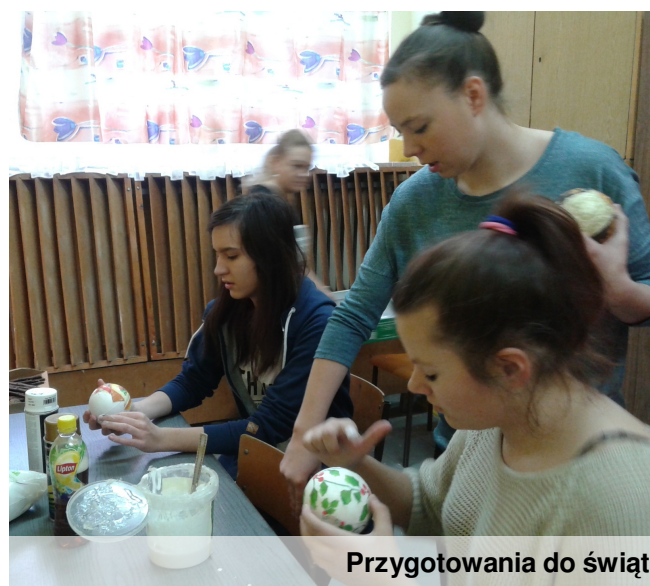
Przygotowania do świąt

WAGA - Już nie wiesz że Św. i uważaj bo Św. długo czeka Cię Mikołaj Mikołaj nie lubi spełnienie powierzył Ci bałaganu! marzeń! pewne zadanie, Szczyśliwe Przygotuj się, bo więc rusz ten liczby - 12, 14 masz prawo tylek sprzed trochę zaszaleć! komputera Jednak nie i zacznij przesadzaj, bo ogarniać swój Św. Mikołaj ma pokój, bo w Cię na oku! innym Szczyśliwe przypadku nie liczby - 6, 9 będzie ci tak PANNA - Czy wesolo. Miej się na baczności