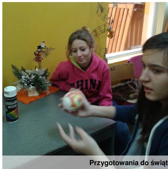
Przygotowania do świąt