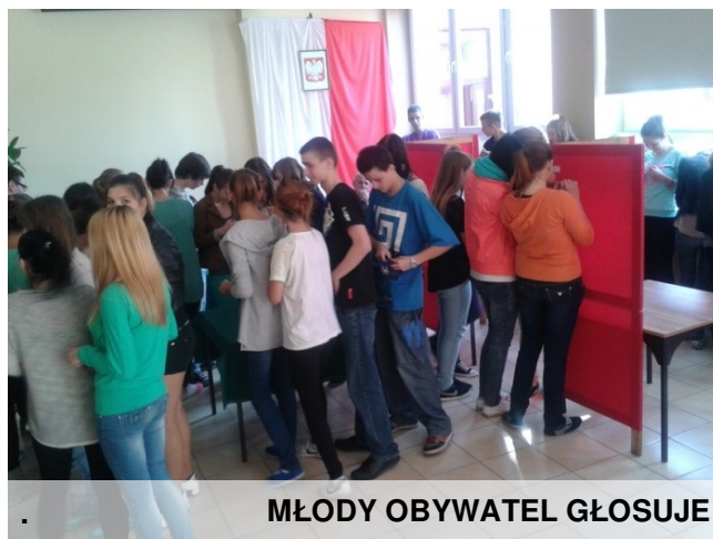
MŁODY OBYWATEL GŁOSUJE