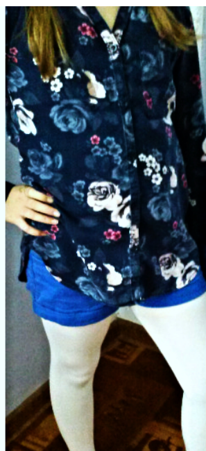
Propozycja stylizacji na wiosnę.