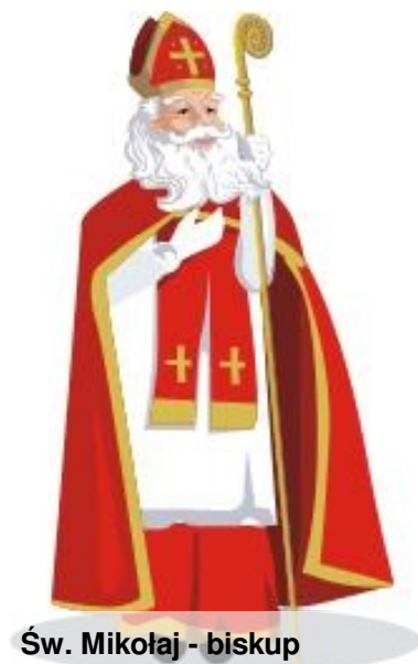
Św. Mikołaj - biskup

W czasie prześladowań uwięziony. Po długich latach błogosławionych rządów zmarł między 345 a 352 r. (brewiarz.pl)