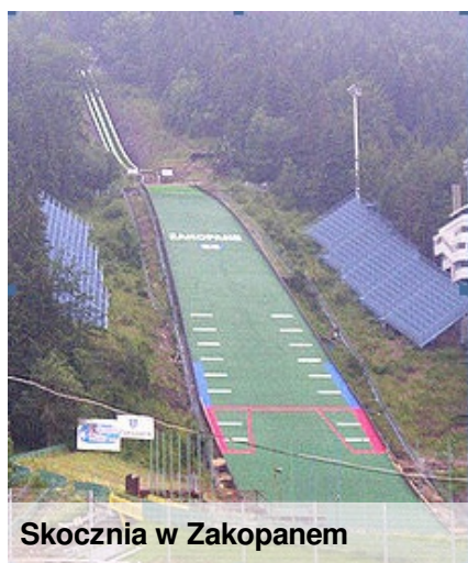
Skocznia w Zakopanem

Skoki narciarskie – rozgrywane są na skoczniach narciarskich już od połowy XIX wieku. Skoki narciarskie wraz z biegami narciarskimi oraz kombinacją norweską (połączenie biegów i skoków) cieszą się popularnością głównie w Europie, zaś poza Europą w Japonii. Celem jest wykonanie jak najdłuższego skoku po rozpędzeniu się i odbiciu od progu skoczni. Na największych skoczniach, tzw. mamucich, możliwe są skoki przekraczające 200 metrów (konkurencję tę nazywa się wtedy lotami narciarskimi). W skokach ocenia się odległość skoku oraz styl skoku.