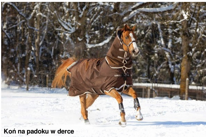
Koń na padoku w derce

Należy jednak pamiętać, że im większa rasa konia tym gorzej znosi zimno, więc należy rozsądnie dawkować pobyt na dworze w bardzo mroźne dni, dbając jednocześnie by koń był odpowiednio żywiony, tak by otrzymana pasza pozwoliła wytworzyć mu wystarczająco dużo energii dla ogrzania organizmu.