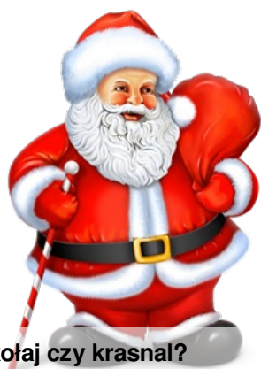
Mikołaj czy krasnal?

Na pewno wiecie kim jest Mikołaj. W waszej głowie otworzy się obraz krasnala z czerwoną czapką, ubrankiem i spodenkami, które obszyte są futerkiem. NIE, św. Mikołaj tak nie wygląda. Św. Mikołaj był biskupem!