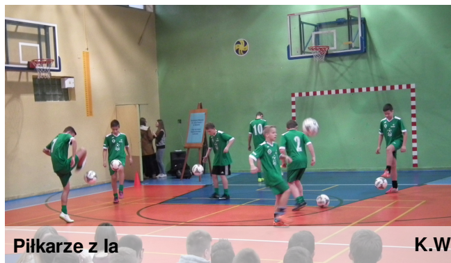
Piłkarze z Ia