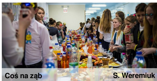
Coś na ząb