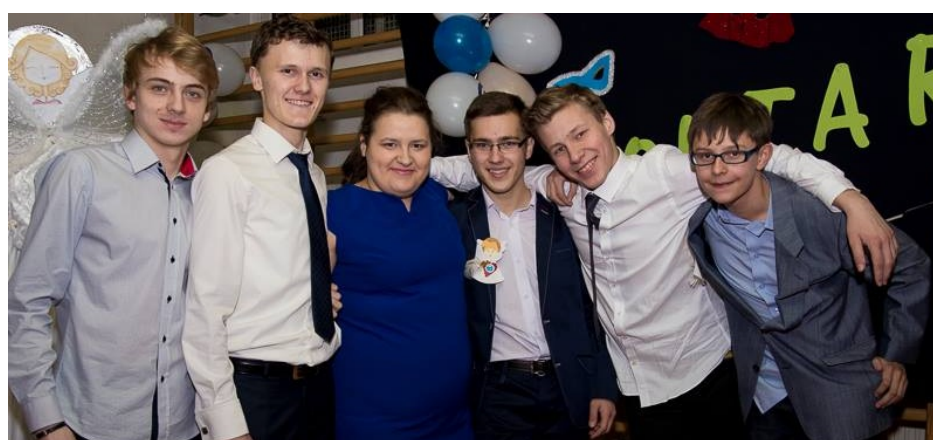
To właśnie my - wolontariusze