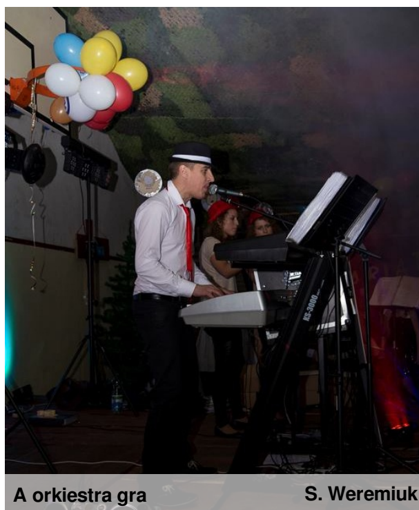
A orkiestra gra