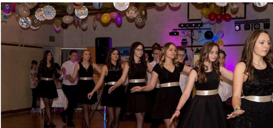
Polonez pięknych gimnazjalistek