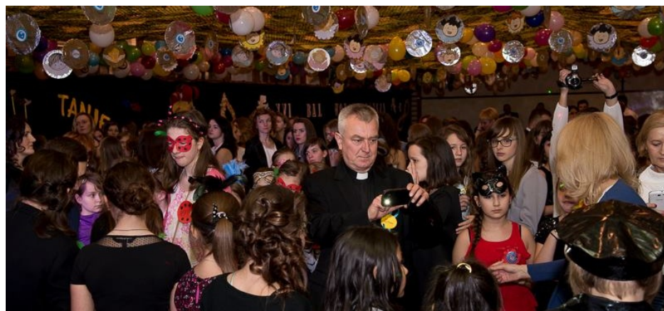
Cała sala tańczy