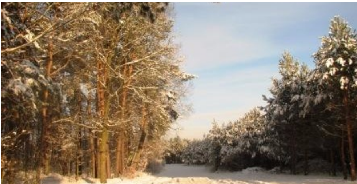
Zima w lesie