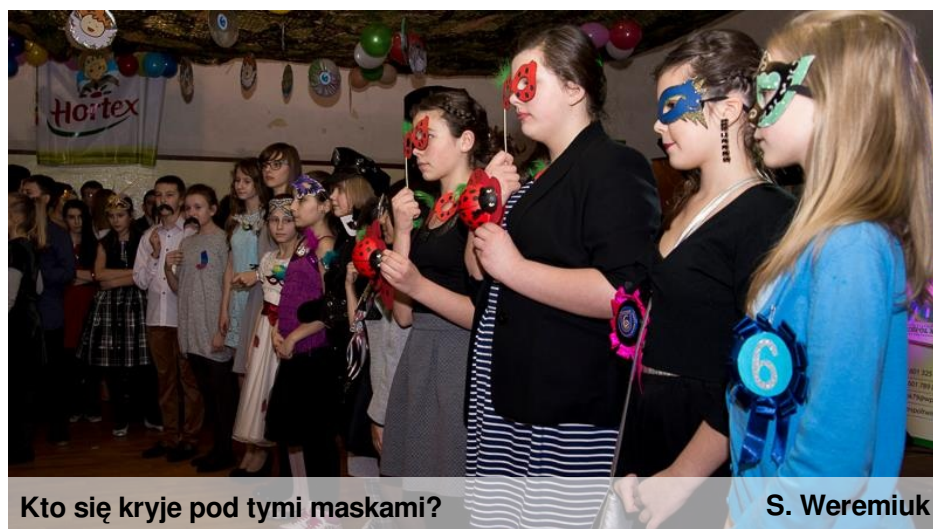
Kto się kryje pod tymi maskami?