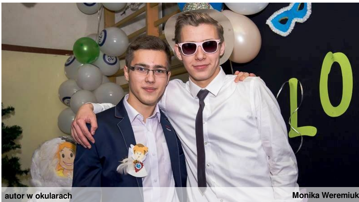
autor w okularach