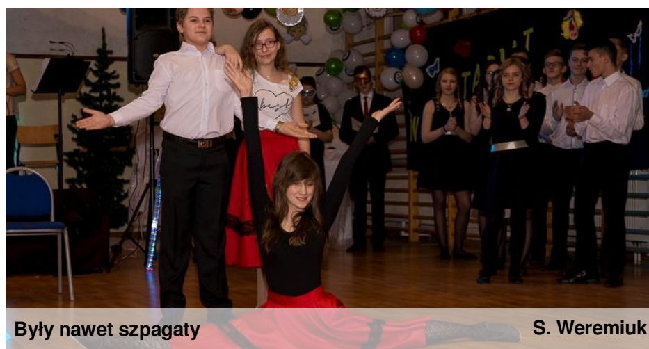
Były nawet szpagaty