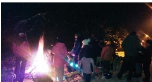
Ognisko na śniegu

dla ciała, ale także duszy. Wybierz się do teatru, muzeum, na koncert. Wiele instytucji przygotowuje specjalny program na ten czas dostosowany do młodego, ciekawego świata odbiorcy. Odpoczynek umysłowy jest równie ważny jak fizyczny. Życzymy Wam zdrowych i bezpiecznych ferii. Abyście naładowali akumulatory na następny semestr nauki.