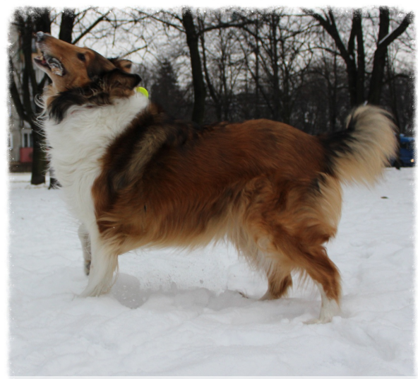
Zabawy na śniegu