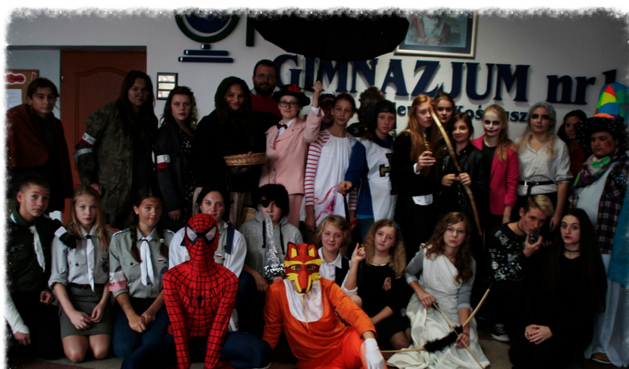
DZIEŃ POSTACI LITERACKICH