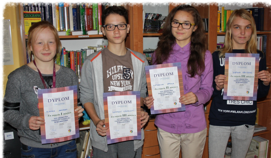
NASI ZŁOCI SPORTOWCY