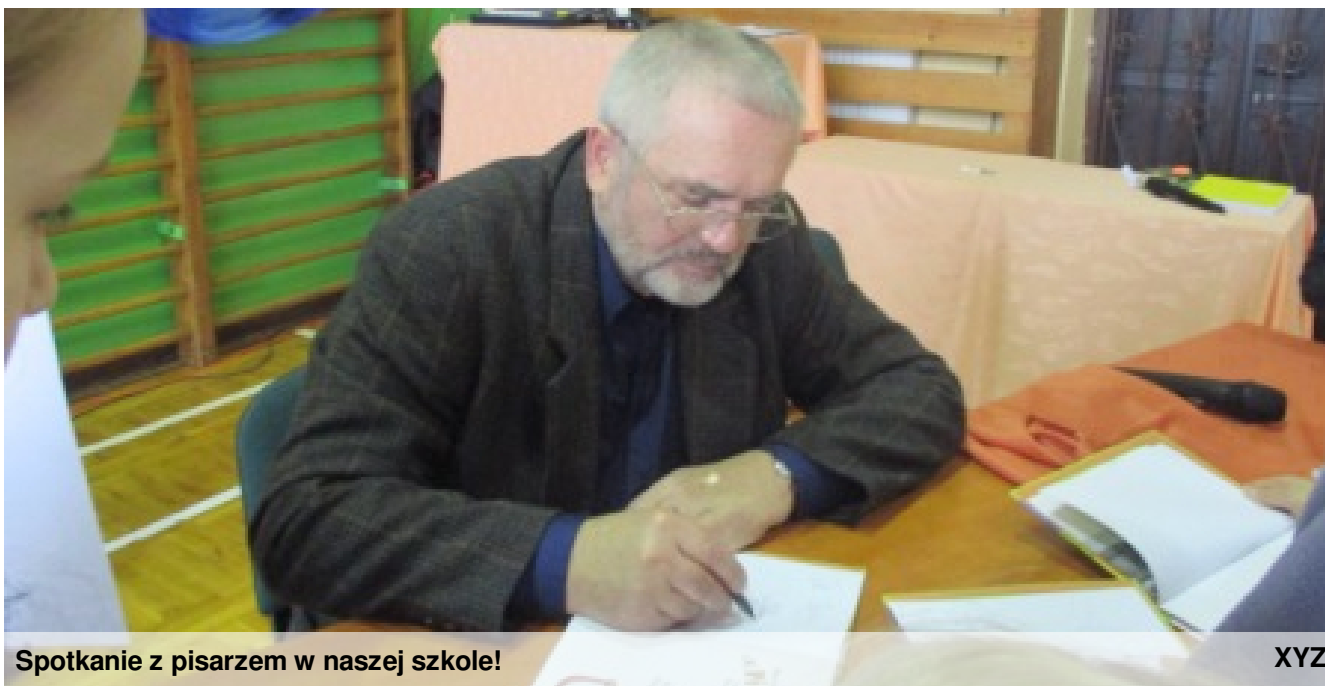
Spotkanie z pisarzem w naszej szkole!