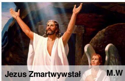
Jezus Zmartwychwstał M.W