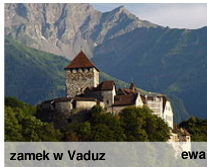
zamek w Vaduz ewa

Zamek w Vaduz – zamek położony wysoko nad miastem Vaduz (stolicy Liechtensteinu), od którego wziął swą nazwę. Został zbudowany w XVI wieku i do dziś jest siedzibą rodziny książęcej Liechtensteinów. Zamek w Vaduz jest historycznym centrum kraju. (ewka)