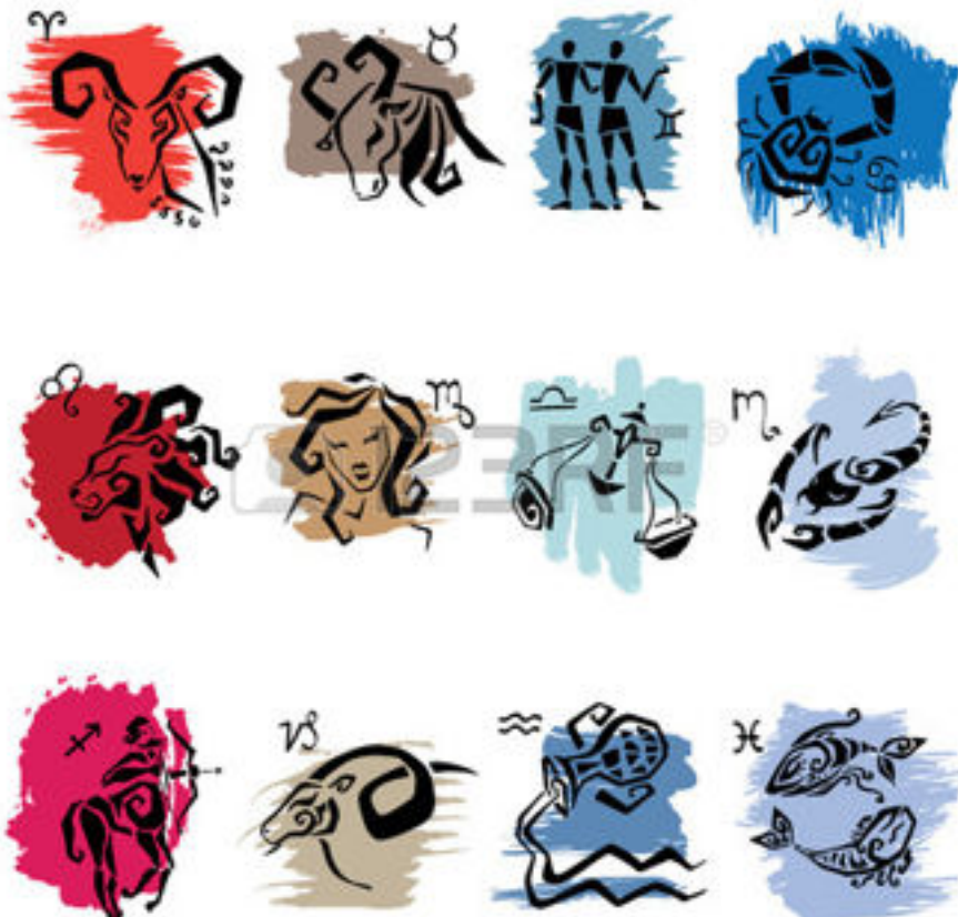
Symbole znaków zodiaku