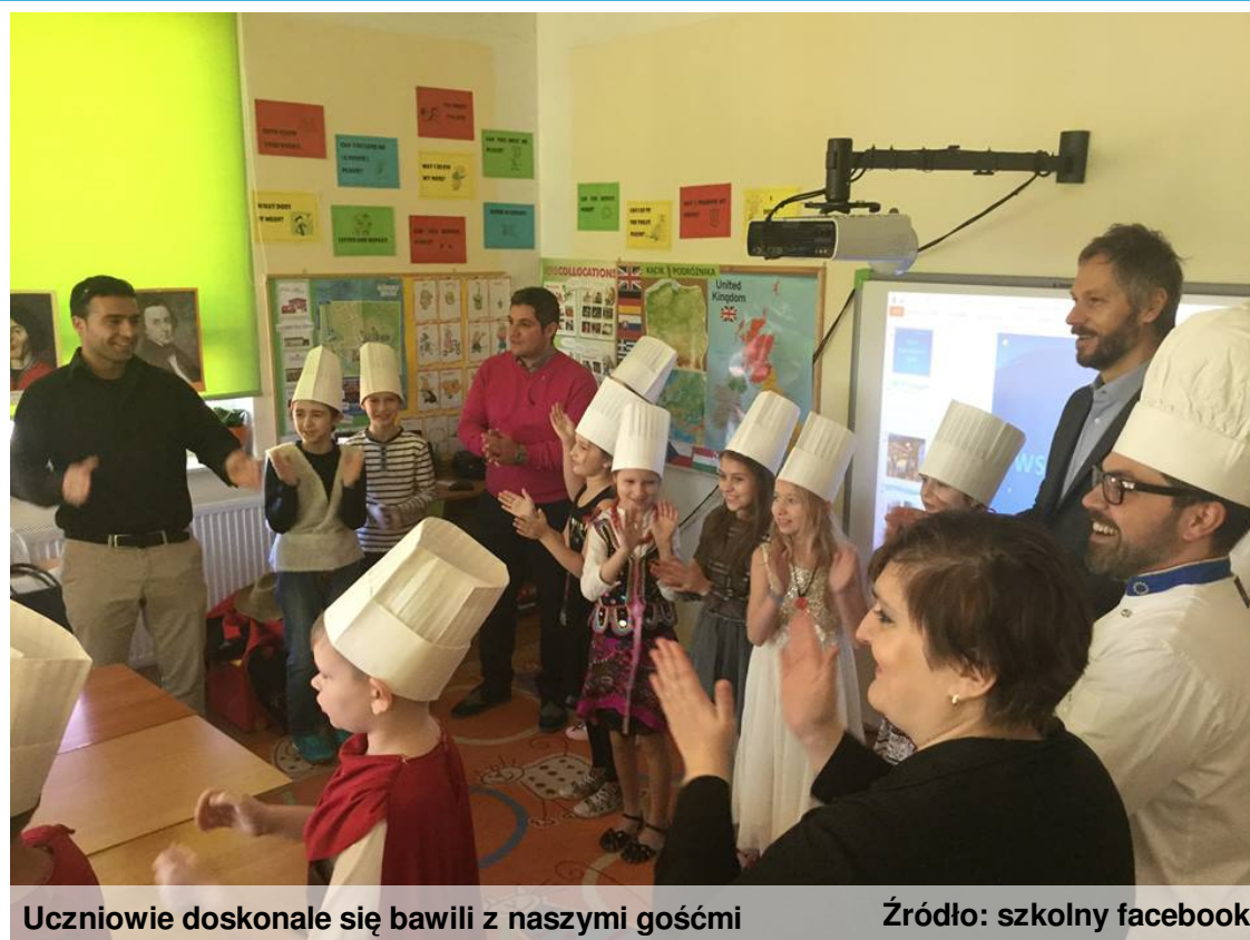
Uczniowie doskonale się bawili z naszymi gośćmi