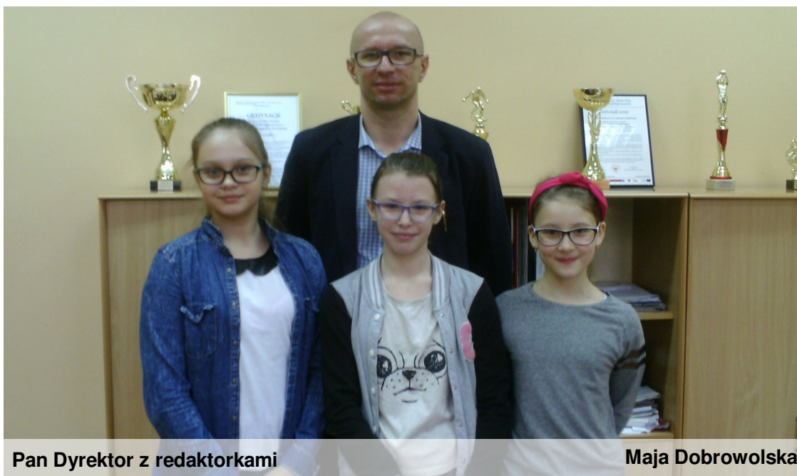
Pan Dyrektor z redaktorkami