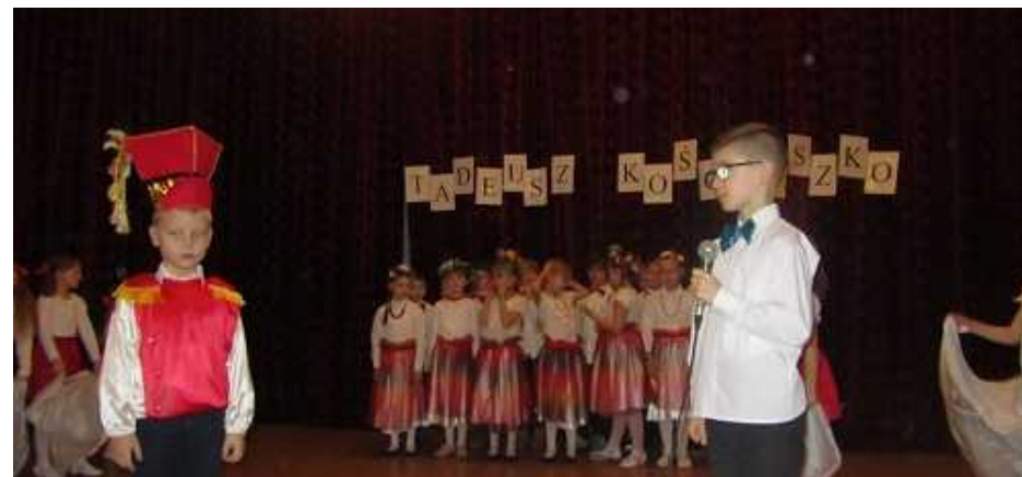
Przedstawienie o Tadeuszu Kościuszcze