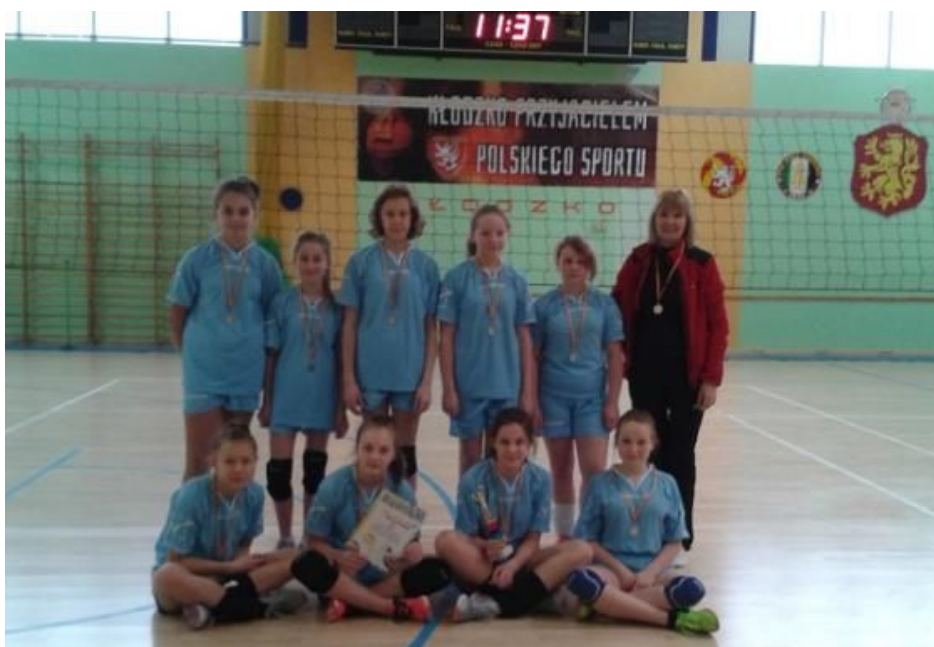
Wicemistrzostwo powiatu w czwórkach