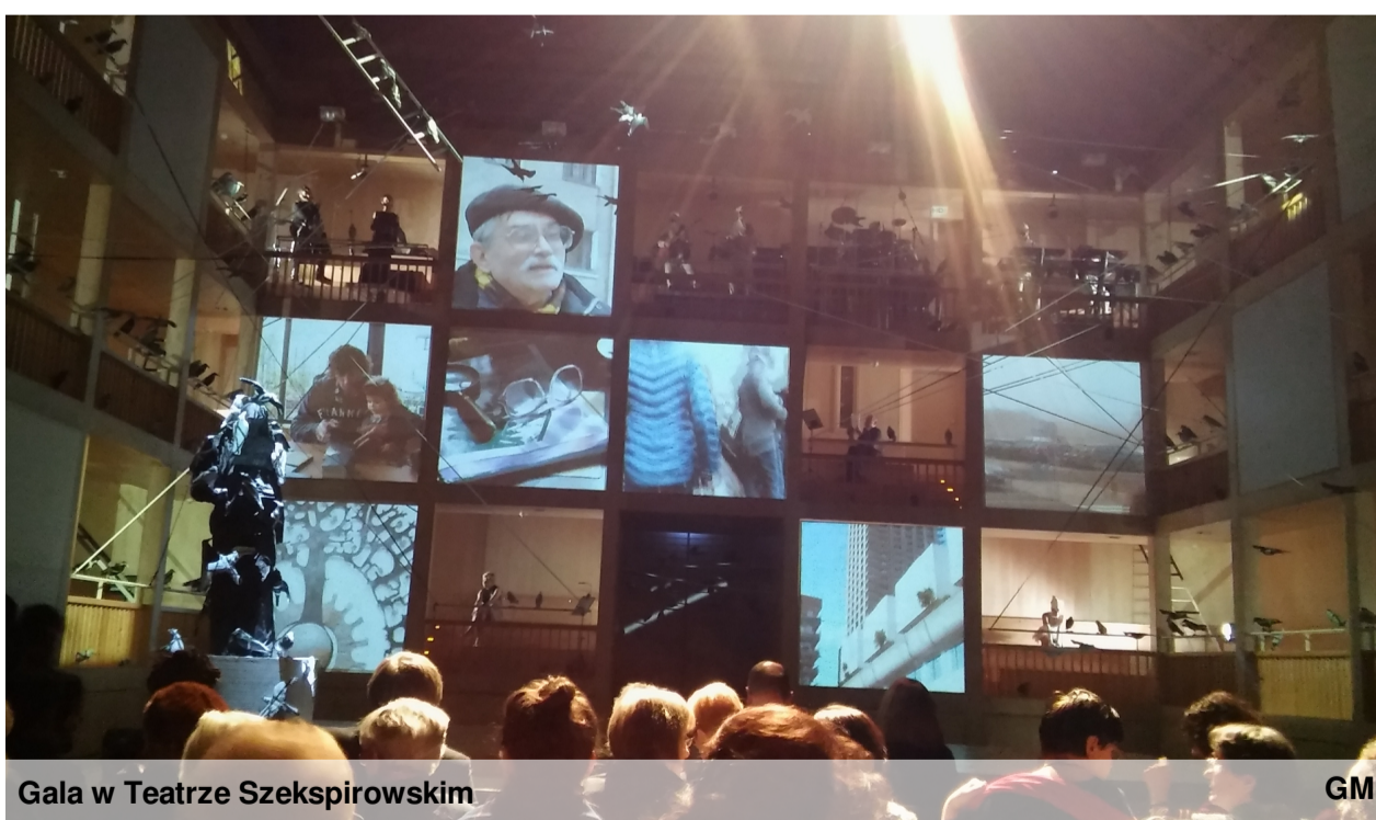
Gala w Teatrze Szekspirowskim