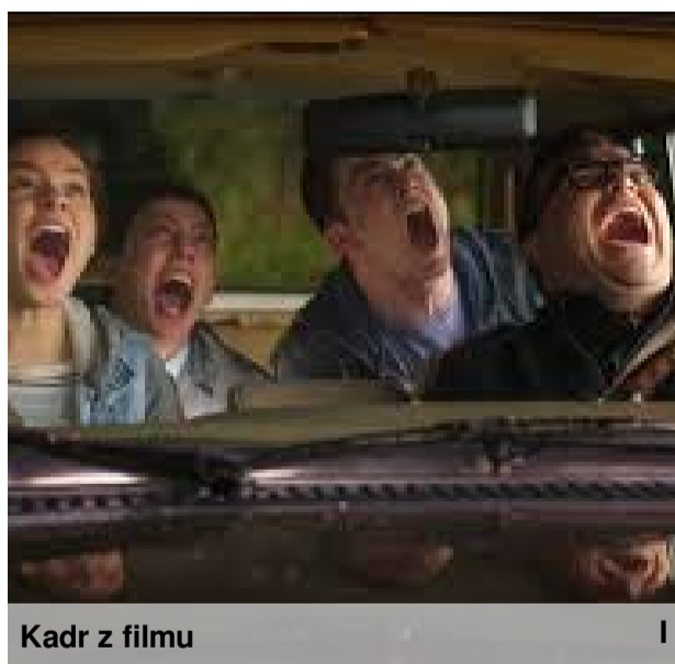
Kadr z filmu

Uczniowie klas trzecich z wychowawcami brali udział w prezentacjach 16 marca 2016 r. w Centrum Kształcenia Zawodowego i Ustawicznego nr 2 w Gdańsku.