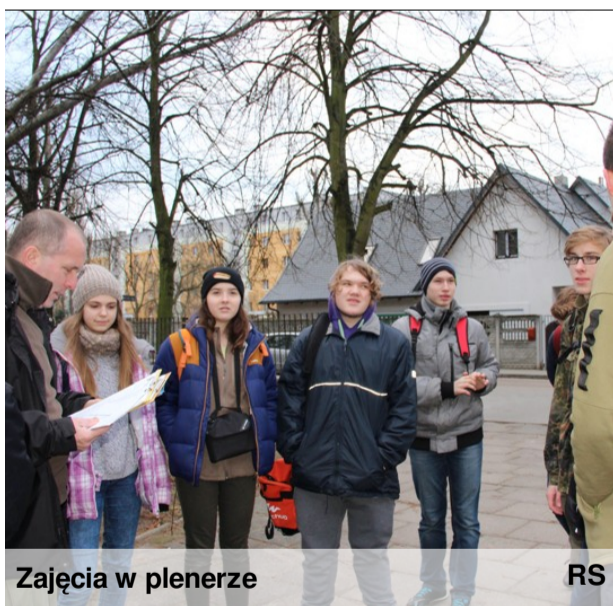
Zajęcia w plenerze