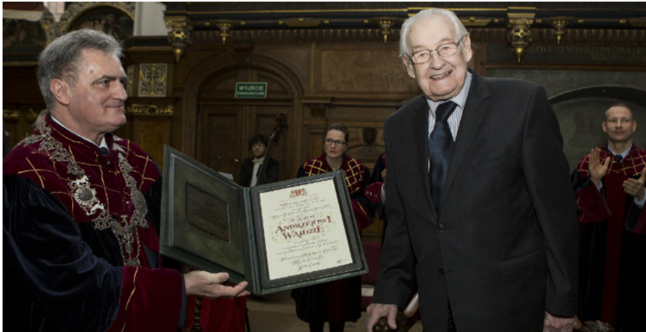
Uroczystość w Dworze Artusa

w dniach 11-14 marca w Europejskim Centrum Solidarności w Gdańsku odbył się przegląd twórczości Andrzeja Wajdy. W ramach przeglądu odbyły się projekcje filmowe, spotkania autorskie oraz dwie wystawy - "Grudzień