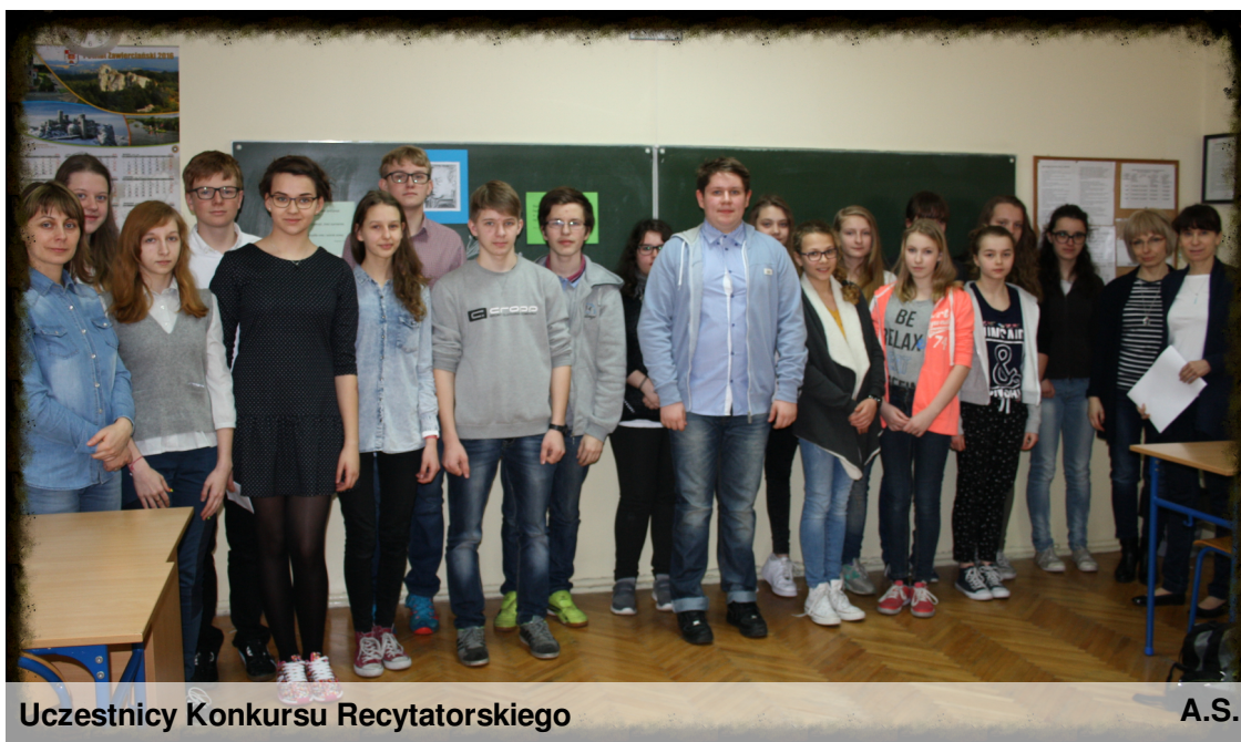
Uczestnicy Konkursu Recytatorskiego