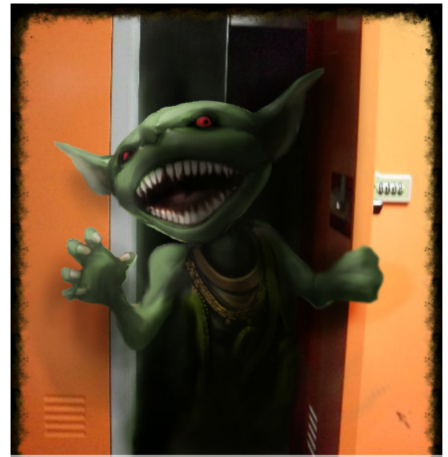
Chochlik w szafce W. Maruszak

Zaufani informatorzy donoszą, że w naszej szkole zamieszkują istoty nie z tego świata! W sali od fizyki grasuje DEMENTOR, który wysysa z nic nie podejrzewających uczniów wiedzę i energię do nauki. W toaletach mieszkają złośliwe DEMONY KAPPA, które wciągają uczniów prosto do muszli klozetowych. To prawdziwy koszmar! Szatnię opanowały CHOCHLIKI KORNWALIJSKIE, które wyrzucają uczniom rzeczy z szafek, niszczą je i tworzą istny chaos. Czym jest spowodowana ta epidemia? Te dwa słowa wyjaśnią wszystko: Prima Aprilis!