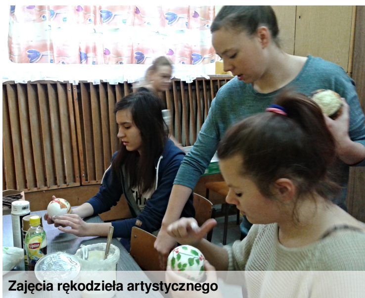
Zajęcia rękodzieła artystycznego